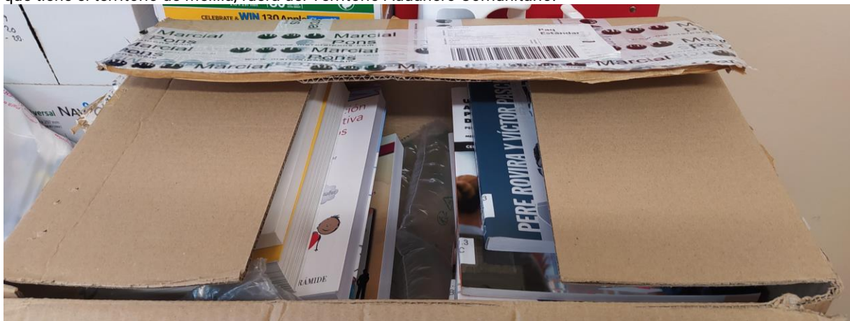
Figura 1. Recepción de los libros encargados a Marcial Pons

En primer lugar, el presupuesto fue cumplimentado, con todo el proceso documental requerido al efecto. Los libros encargados a Marcial Pons llegaron finalmente al Campus de Melilla (Figura 1). Posteriormente, un encargo a Vistalegre de material fungible (Figura 2) para la realización de los cursos (folios, carpetas y bolígrafos) fue también correctamente recibido. La gestión documental fue lenta y muy laboriosa, debido a la especial condición que tiene el territorio de Melilla, fuera del Territorio Aduanero Comunitario.