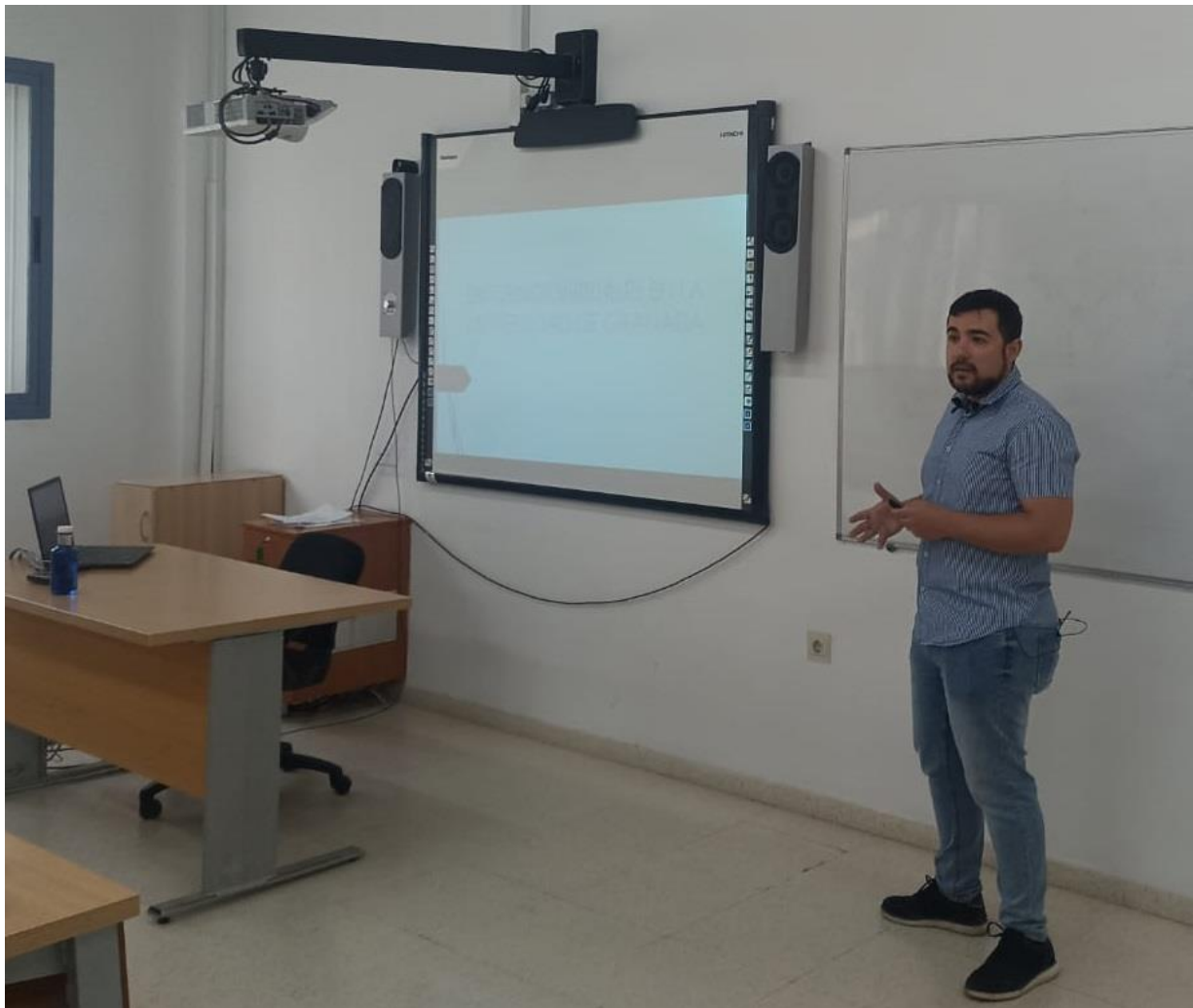
Figura 9. Desarrollo del tercer curso