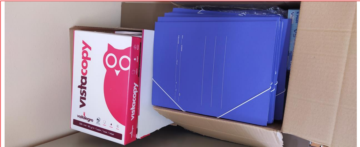
Figura 2. Recepción del material fungible encargado a Vistalegre

Una vez recibido el material, se procede a la organización y planificación de los cursos. Realizado esto, las aulas son reservadas por el sistema SUCRE (Figura 3). Se elabora un cartel con toda la información del programa ya disponible (Figura 4), dándole difusión mediante redes sociales (Figura 5) y carteles que fueron colocados en diversos puntos del Campus de Melilla (Figura 6).