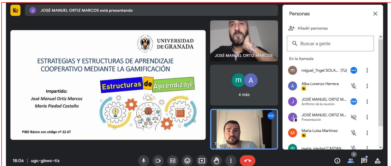
Figura 8. Desarrollo del segundo curso