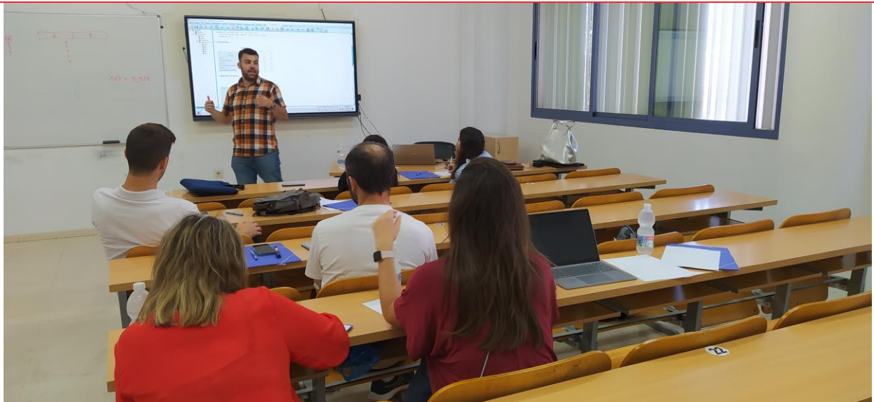
Figura 10. Desarrollo del cuarto curso

La aplicación a la docencia habitual de los contenidos abordados es directa. La puesta en conocimiento y de relevancia de aplicaciones como Office 365, Padlet, Google Drive, Google Meet, EdCanvas, Prezi, Kahoot, Minecraft Education Edition y otras permiten al docente una aplicación real en sus clases. El manejo básico de SPSS es esencial tanto para el docente como para los alumnos, especialmente para el tratamiento estadístico de bases de datos en Trabajos Fin de Grado (TFG), Trabajos Fin de Master (TFM), Tesis Doctorales, etc.