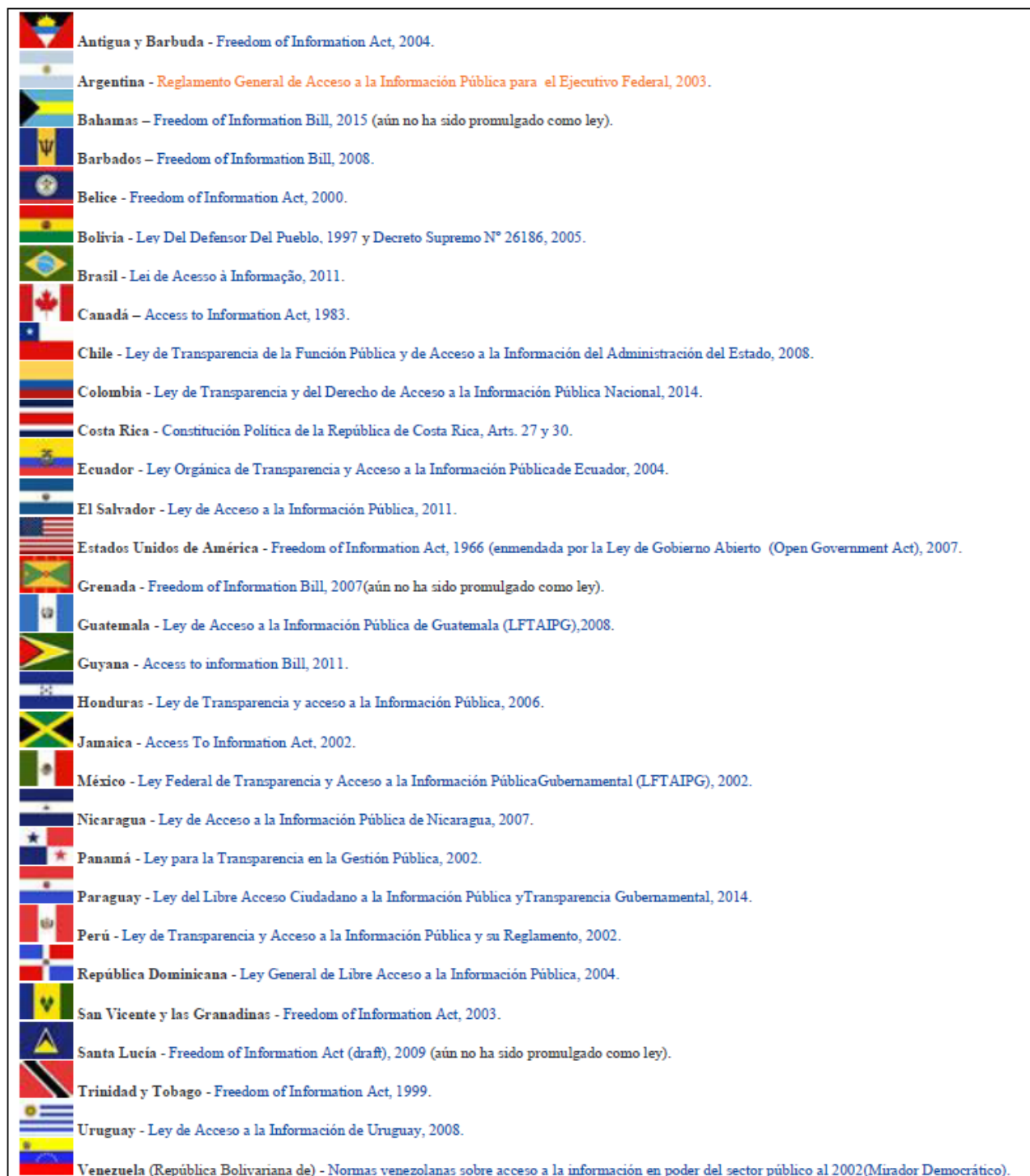
Figura 2: Las leyes de acceso a la información en los países de América