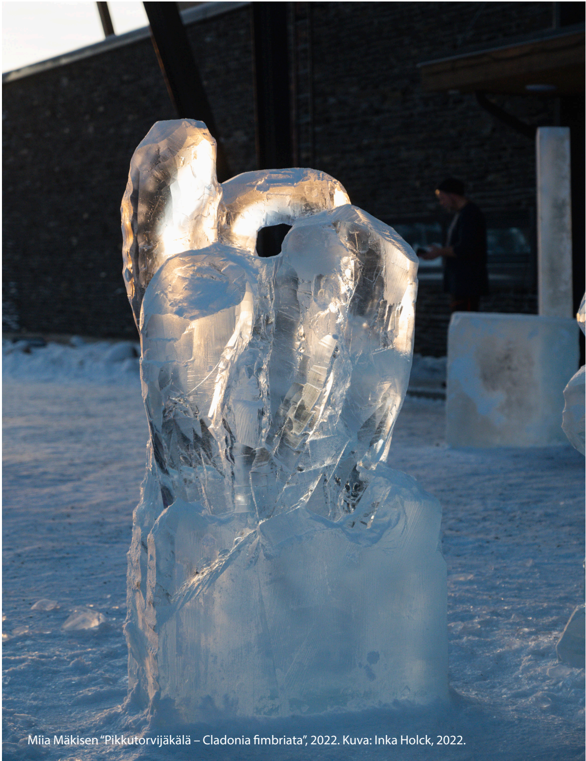
Miia Mäkisen "Pikkutorvijäkälä – Cladonia fimbriata", 2022.