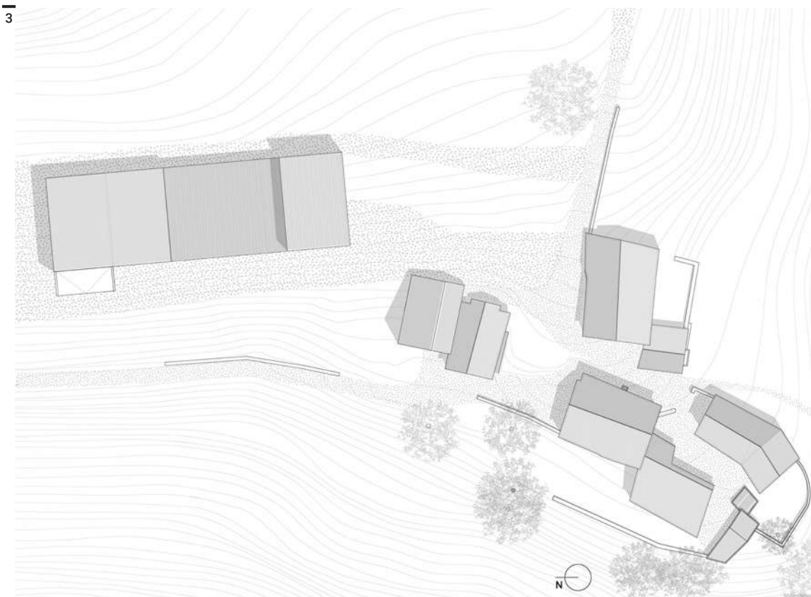
Fig. 2 Gli spazi aperti.