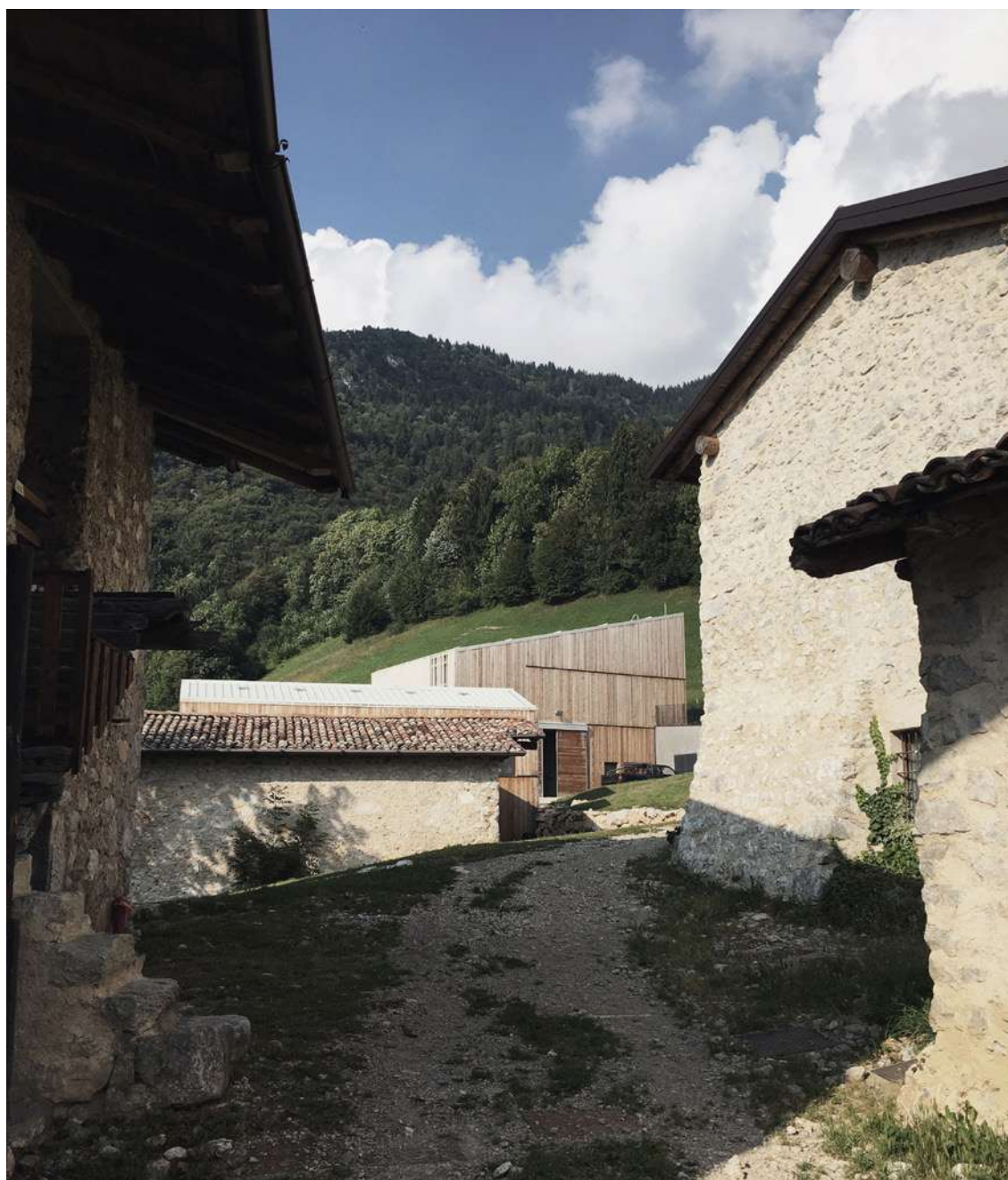
Fig. 10 Vista dei nuovi interventi dall'edificato storico.

zie alla collaborazione, tra gli altri, della Scuola Edile di Bergamo, dell'Università della Montagna di Edolo e della Soprintendenza ai Beni Culturali della provincia di Bergamo e Brescia. Infine, tra il 2021 e il 2022 è stato portato a termine il restauro del ristorante, grazie alla collaborazione con l'architetto Nicola Guercilena, che ha curato la fase progettuale esecutiva e ha diretto i lavori. Il cantiere ha visto la partecipazione di diverse imprese, privilegiando quando possibile l'intervento di artigiani locali, soprattutto per alcune lavorazioni tradizionali, come il restauro degli intonaci in calce o dei pavimenti in ciottoli (rès).