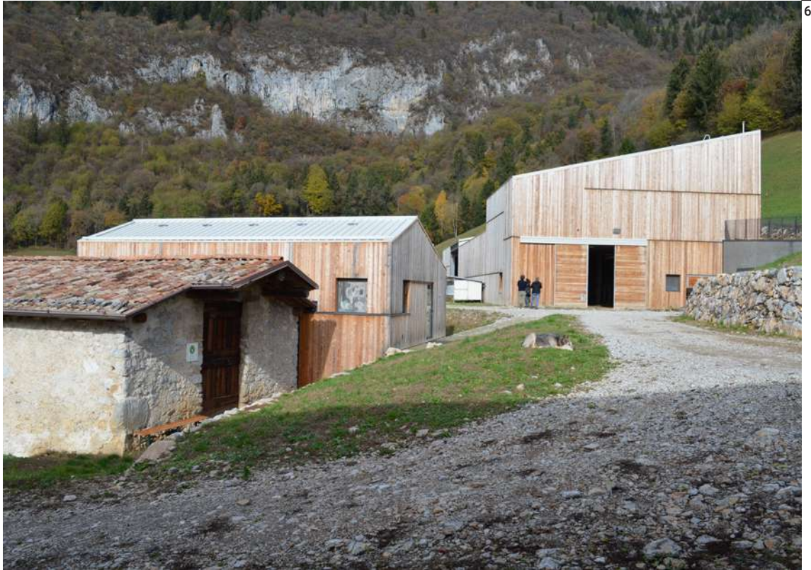
Fig. 6 Vista esterna, la stalla e il caseificio da Sud.