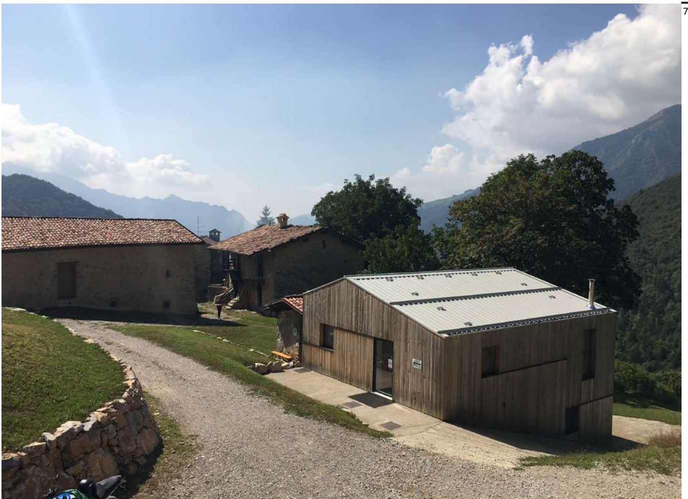
Fig. 7 Vista esterna, il caseificio da Nord-Est.