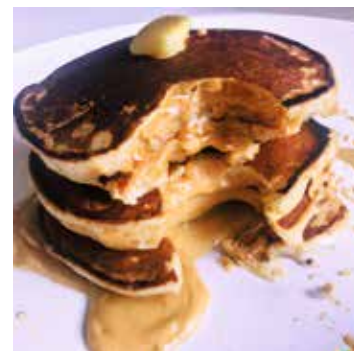
Beelden van een ei-pindakaas-pannenkoek, gegenereerd met DALL-E

K unstmatige intelligentie (AI) is niet meer weg te denken uit het dagelijks leven: je beste vriendin deelt haar door AI verbeterde portretfoto, waardoor ze er ineens uitziet als een middeleeuwse prinses en je kind mompelt dat het zeer verleidelijk is om ChatGPT te gebruiken voor een ‘domme schrijfpdracht’ van school.