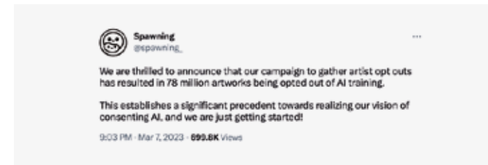
Figuur 3. Creatieve professionals komen in opstand tegen de ontwikkelaars van de nieuwe generatie AI-tools vanwege de (mogelijk) negatieve impact op hun beroepspraktijk.

Er is een beroemde uitspraak die hier goed past, overigens vaak incorrect toegeschreven aan de Canadese filosoof en technologiegoeroe Marshall McLuhan. Het was eigenlijk zijn collega John Culkin die zei: “We shape our tools and thereafter our tools shape us.” Wanneer we nieuwe tools ontwikkelen met behulp van AI en ze loslaten in de wereld, moeten we anticiperen op - en ons wapenen tegen - mogelijke negatieve en onbedoelde gevolgen. Het nieuws stond de afgelopen maanden bol van verhalen over griezelige conversaties met ChatGPT en onvoorspelbare ‘hallucinaties’. Er werd gewaarschuwd voor het einde van het essay, het einde van de journalistiek, de dood van de auteur (al gaat deze claim al langer