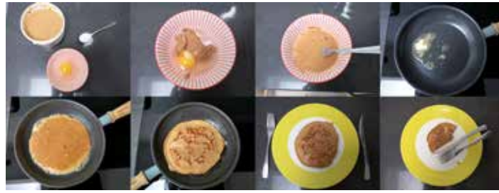
Figuur 2. De ei-pindakaas pannenkoek van ChatGPT was ongebruikbaar, maar geen blijvertje.