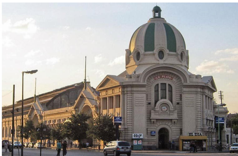
Foto de una estudiante que considera a la Terminal de Trenes como lugar inseguro