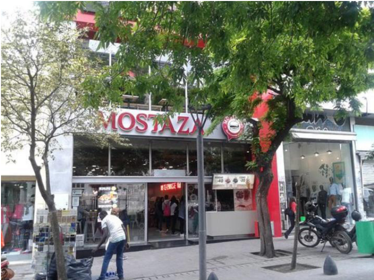
Foto de una estudiante que siente seguridad en una zona muy comercial