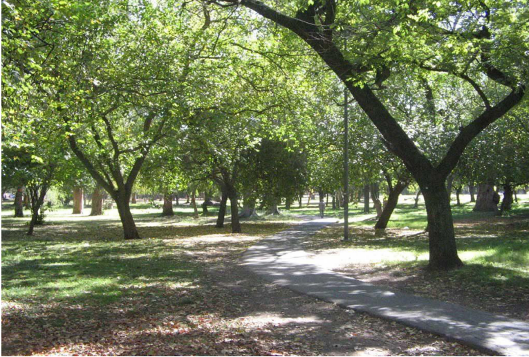
Foto de una estudiante que siente mucha inseguridad en el Paseo del Bosque