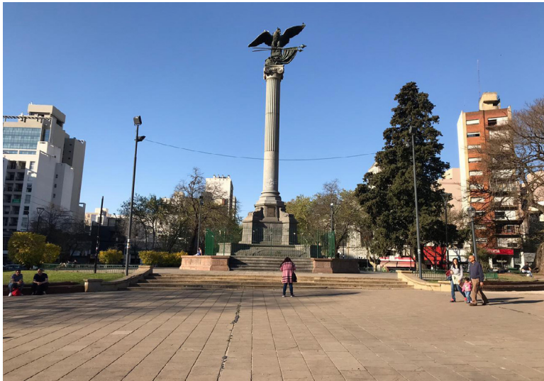
Foto de un estudiante que considera segura a la Plaza Italia