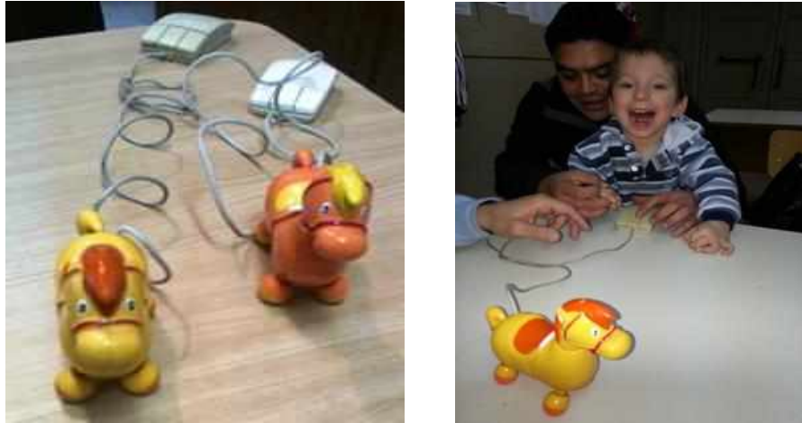
Figura 3: Caballito asociado a un mouse de PC. El caballito es motivador para el entrenamiento en la relación causa-efecto.

El caballito, tal como se observa en las figuras es un dispositivo de hardware de ayuda técnica, desarrollado a partir de un juguete comercial alimentado por pilas, para mejorar la comunicación de un usuario que posee dificultades motrices severas