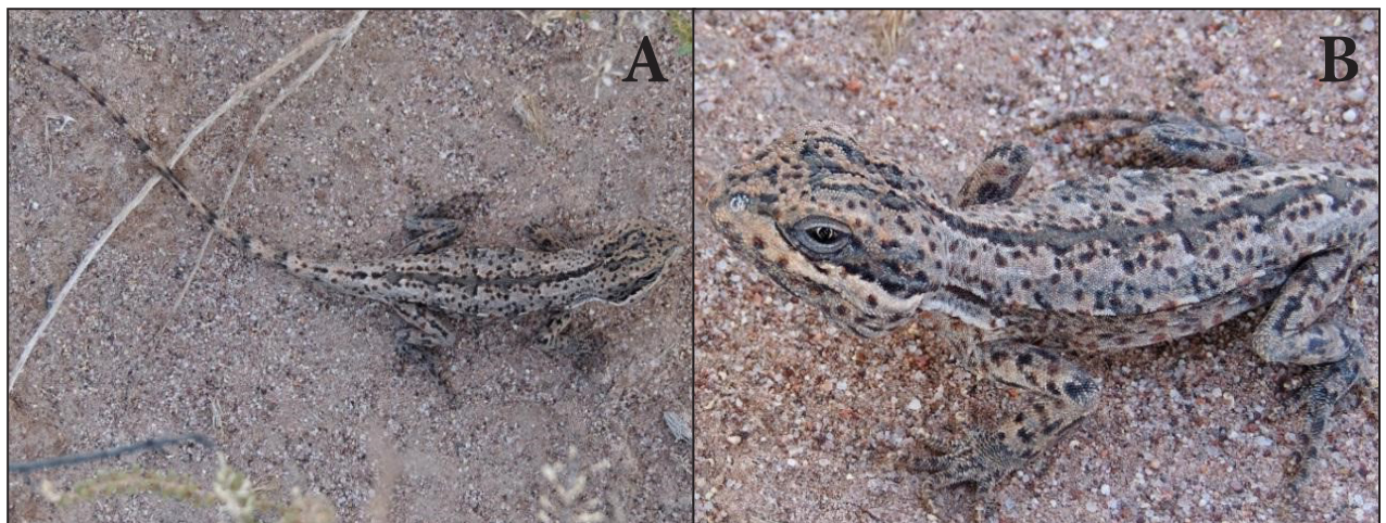
Figura 1. Fotografías del ejemplar de Leiosaurus jaguaris registrado en el Parque Nacional Talampaya, provincia de la Rioja, Argentina (en 2020). (A) Vista dorsal general. (B) Vista dorso-lateral de la parte anterior del cuerpo.

En el presente trabajo se da a conocer el hallazgo de Leiosaurus jaguaris dentro del Parque Nacional Talampaya (PNT), que conserva la ecorregión de Monte de Sierras y Bolsones, la cual se caracteriza por presentar una estepa arbustiva xerófila o halófila, con bosques marginales de algarrobos ( Prosopis sp.). Tiene un clima desértico, caracterizado por variaciones extremas de temperatura, que oscilan entre -7°C y 40°C, con precipitaciones menores a 200 mm anuales (APN, 2019). El ejemplar de L. jaguaris fue registrado de manera ocasional durante la realización de un muestreo de vegetación (DRC-383; Fig. 1), el día 4 de marzo de 2020 a las 10.30 am., bajo una planta de zampa ( Atriplex sp.) en una zona caracterizada por la presencia de médanos, con parches de vegetación conformada principalmente por jume ( Allenrolfea vaginata ), jarilla ( Larrea cuneifolia , L. divaricata ) y zampa ( Atriplex sp.). Como no