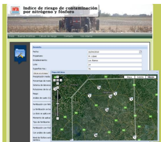
Figura 1. Planilla de cálculo: encuesta datos del establecimiento y mapa para ubicar el predio con el polígono indicando los límites de la determinación de vulnerabilidad.

Una vez grabada la ubicación del lote, se podrá completar la encuesta con toda la información solicitada. Al finalizar la carga de datos se deberá grabar el informe para poder obtener la hoja de resultados. En esta hoja se podrá ver la valoración de los índices de riesgo de contaminación, de vulnerabilidad y de carga de N y P.