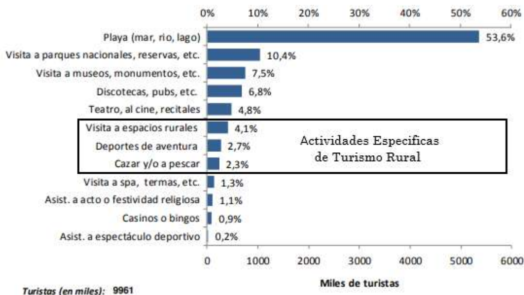
Figura 2. Turistas internos. Realización de actividades turísticas. 1er cuatrimestre de 2019. En cantidad de turistas y porcentajes.