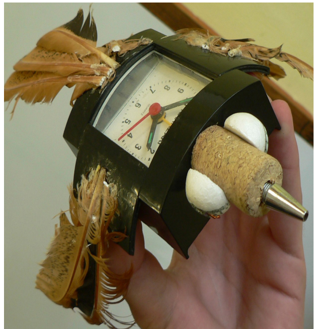
Figuras 4 y 5. Producción de alumnos de la Escuela Nacional Pérez Esquivel

Fueron once, de treinta, los estudiantes que respondieron cosas como estas: “Expresa sentimientos”, “Expresión de pensamientos”. La segunda división de las respuestas –elaboradas por nueve alumnos– se refería a una cuestión disciplinar: “Es un dibujo, una escultura, una pintura, etc.” Otras respuestas fueron: “Lo que el artista imagina”, “Creación simbólica”, “Una creación como un libro, película, composición musical”, “Medio de comunicación que expresa sentidos y creencias”, “Cuadro donde el pintor expresa su talento”.