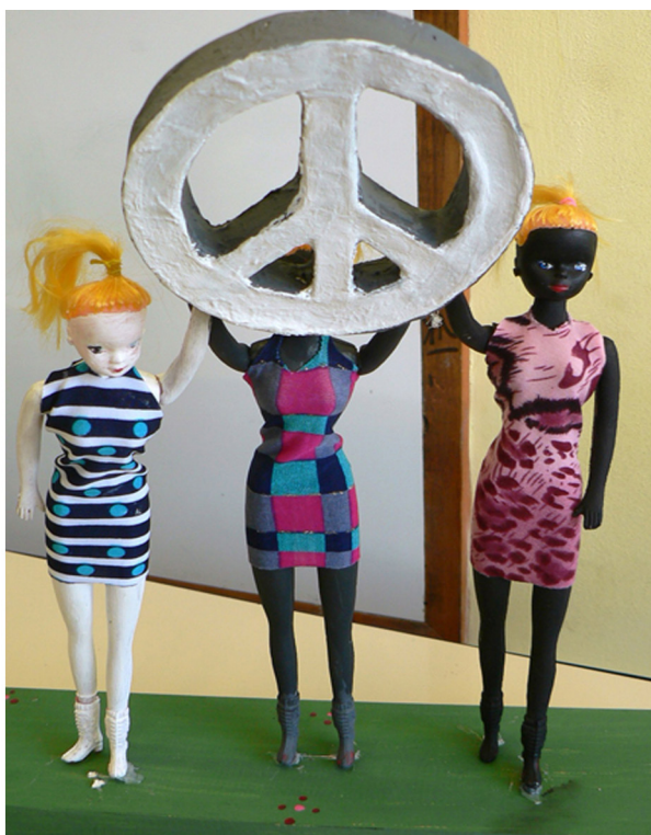
Figura 1. Producción de alumnos de la Escuela Nacional Pérez Esquivel

comparaciones clásicas entre ojos y estrellas, por ejemplo. El autor cita relaciones de lo más diversas entre estos conceptos para dar cuenta, justamente, de su conclusión: aunque el modelo sea esencialmente el mismo, el poeta nos hará sentir disímiles sensaciones. La clave radicaría en el acierto de la combinación, y siguiendo los conceptos de Adorno, en la interrelación entre dialéctica del material y dialéctica histórica; sobre todo si atendemos al análisis propuesto por Borges del poema de Cummings que dice “la terrible cara de Dios, más brillante que una cuchara, acoge la imagen de una palabra fatal [...]” (Borges, 2001), desde estos conceptos adornianos. El hecho de que el autor haya pensado en una cuchara, como algo radiante posible de comparar con la cara de Dios, da cuenta de esta interrelación. Este autor excusa al poeta posicionándose en su época y dice: “No, que soy moderno, así que meteré una cuchara.” Si pensamos en una metáfora visual de la misma magnitud, en cuanto a la dialéctica del material, un ejemplo clave sería la obra “Fuente,” de Marcel Duchamp.