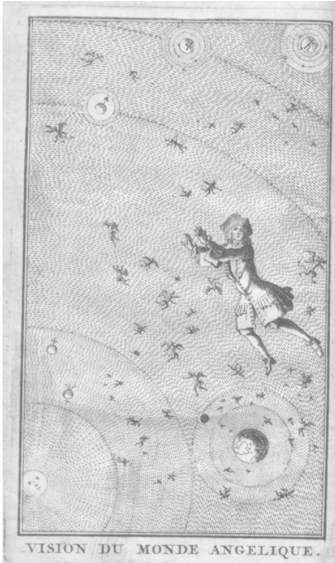
Abb. 2: Vision du Monde Angelique (Frontispiz)

Daniel Defoe: Reflexions serieuses et importantes de Robinson Crusoe Faites pendant les Aventures surprenantes de sa Vie. Avec sa vision du monde Angelique. Amsterdam: Chez l'Honoré et Chatelain 1721. Universitätsbibliothek Erlangen-Nürnberg. Signatur H58/EZ-II 479[3]. http://digital.bib-bvb.de/webclient/DeliveryManager?custom_att_2=simple_viewer&pid=4345452 .