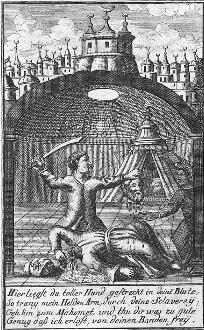
Abb. 4: Thüringischer Robinson, Das ist: Robinson Baackers, eines gebohrnen Thüringers, curieuse Lebens-Beschreibung, In welcher zu finden Dessen schwere vierfache Türkische Slavery, remarquable Befreyung, glückliche Flucht nach Galatha, und vergnügte Wiederkunfft in sein Vaterland, Leipzig, Frankfurt 1737, Frontispiz.