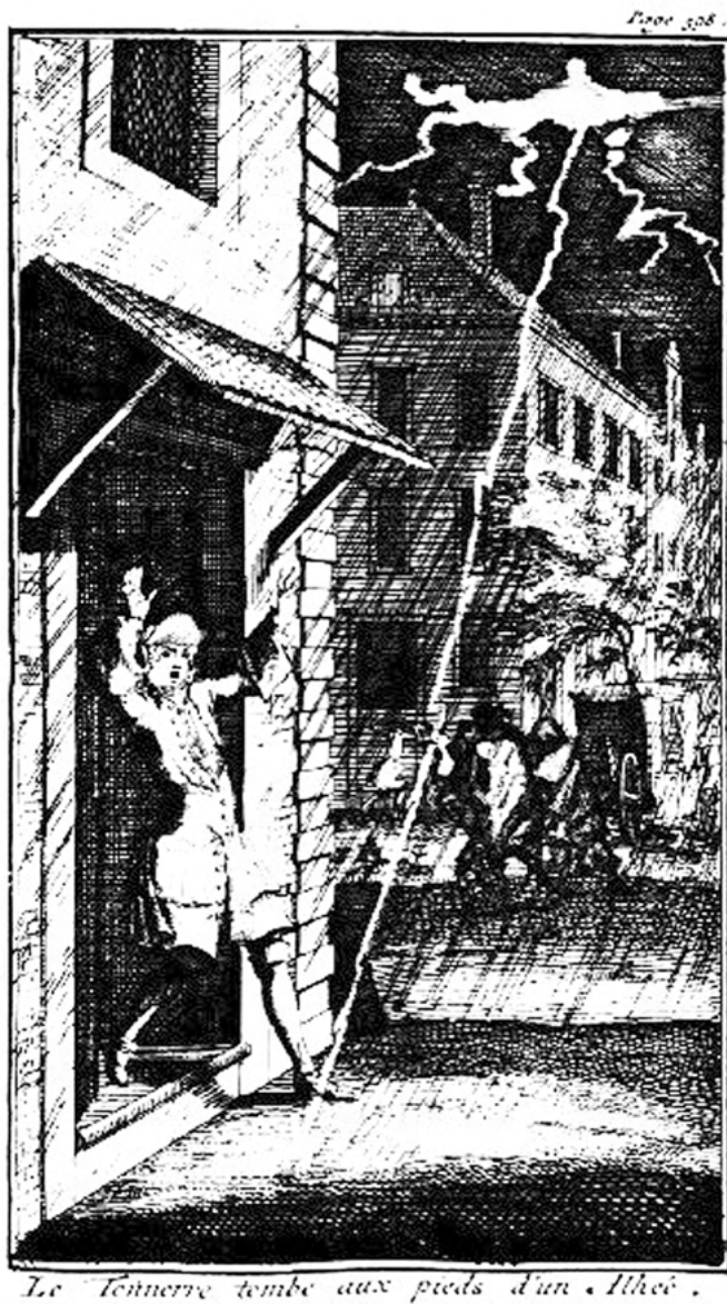
Abb. 3: Reflexions Sérieuses Et Importantes De Robinson Crusoe Faites pendant les Aventures surprenantes de sa Vie, Amsterdam 1721, S. 599. Universitätsbibliothek Erlangen-Nürnberg, H58/EZ-II 479[3, http://digital.bib-bvb.de/webclient/DeliveryManager?custom_att_2=simple_viewer&pid=4345452 .