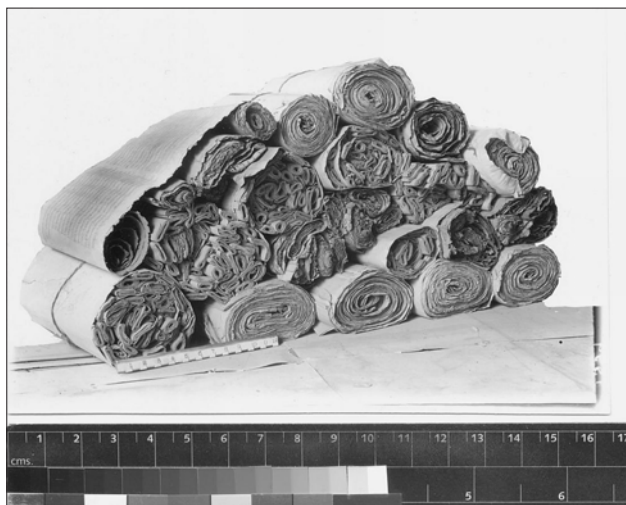
Kéziratköteg a barlangkönyvtárból

Kína Gansu tartományában, Dunhuangtól délkeletre mintegy tizenöt kilométer távolságban, egy sziklafalban található az Ezer Buddha barlangtemplomok. A negyedik század közepétől virágzó buddhista közösség élt itt, melynek tagjai mintegy ezer éven keresztül építették és díszítették a barlangszentélyeket. Ma 492 barlangban 45 ezer négyzetméternyi falfestmény és több mint kétezer stukkó szobor alkotja azt a csodá-