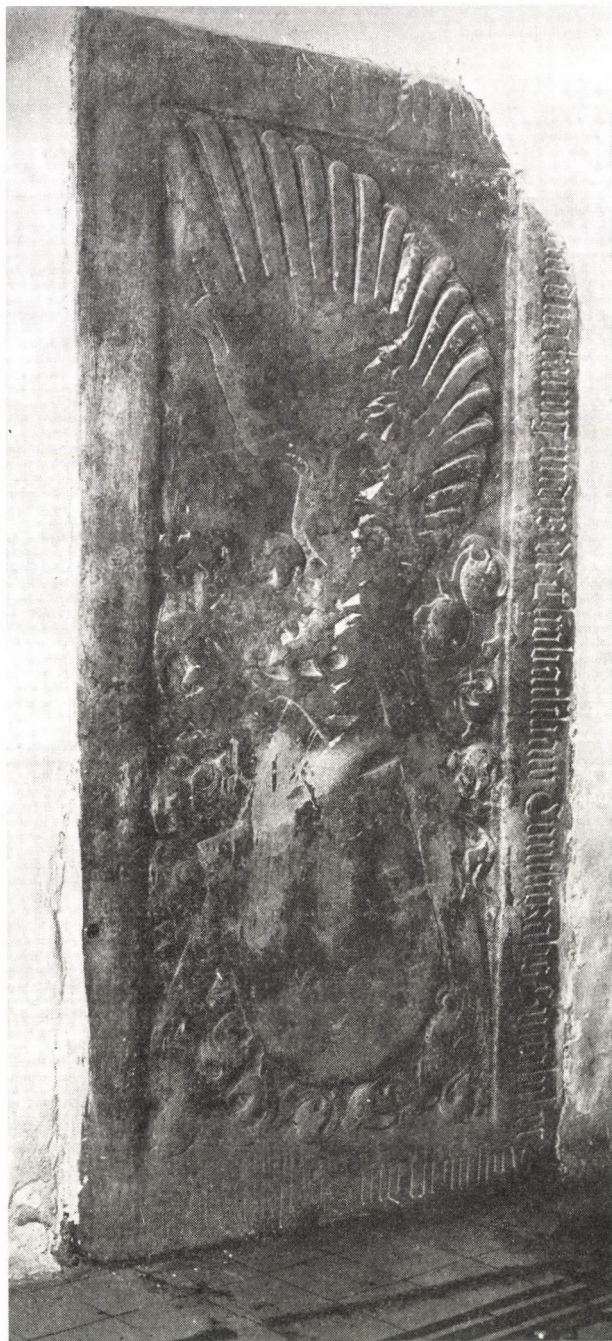
2. Kunigunda sírköve, Máriavölgy

mított. Mutatja azonban a Scharfeneck név is, mert ilyen nevű hely (vagyis vár) a Lajtától keletre akkor még nem létezett. A család eredetét kutatva a szálak a Rajna vidékére vezetnek: amikor XI. Gergely pápa Avignonban 1376-ban a szász Goblint kinevezte erdélyi püspökké, egyúttal felhatalmazta, hogy kísérőjének, Scharfenecki János miles fiának, Frigyes clericus nak a speyeri székeskáptalanban kanonoki javadalmat adjon. Speyertől mintegy 30 km-re NyDNY-ra, Landau közelében feküdt az a Scharfeneck (Altscharfeneck) vár, amelyet e pillanatban a család származási helyének kell tartanunk. Az ottani birtokos család ugyanis 1416-ban halt ki, és a vár ekkor a pfalzi választófejedelem birtokába került. Ha tekintetbe vesszük, hogy a Magyarországon szereplő Scharfeneckiek