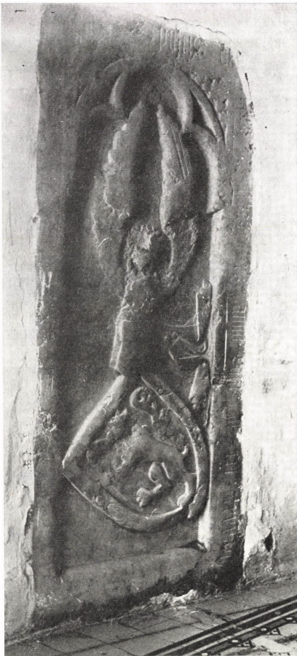
1. Scharfenecki János sírköve, Máriavölgy