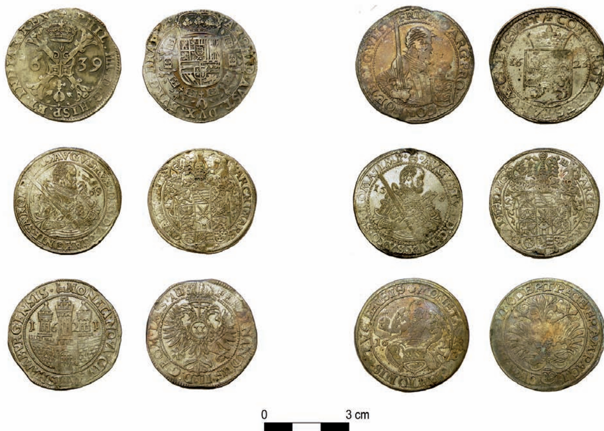
7. kép: Tallérok a drávatamási leletből

a második leletről csak annyit tudunk, hogy egy bőrszényben ezüst denárokat találtak, így e lelet idesorolása csak feltételes. A zamárdi éremleletet Mária királyné uralkodása alatt rejthették el, esetleg Zsigmond uralkodásának az elején. A somogyaszalói és a szulimáni leletről is csak annyit tudunk, hogy Zsigmond-kori érmek voltak benne. A 3658 darabból (Gedai István egy másik helyen 3932 darabot említ) – többségében bécsi denárokból – álló Somogyacsa-Gerézdpusztán előkerült éremlelet záródása a 14. század első felére tehető, ami különlegesnek számít, hiszen ilyen nagy számban ezen érmek ezen a területen nagyon ritkán fordulnak elő. A Béndéken talált leletről pedig csak annyit tudunk, hogy bécsi fillérek voltak benne, és valószínű, hogy 14. századi. Újabban további egy leletre hívták fel a figyelmem, amely Tapsonyban került elő a 19. században. 32