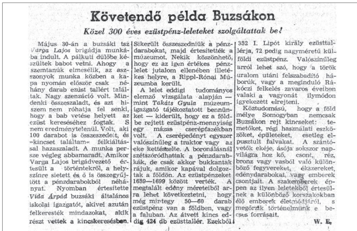
4. kép: Újságcikk a buzsáki éremleletről