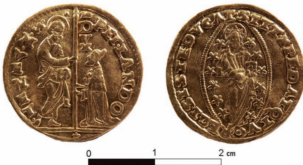
5. kép: Pietro Lando arany dukátja a balatonendrédi leletből, Velencei Köztársaság