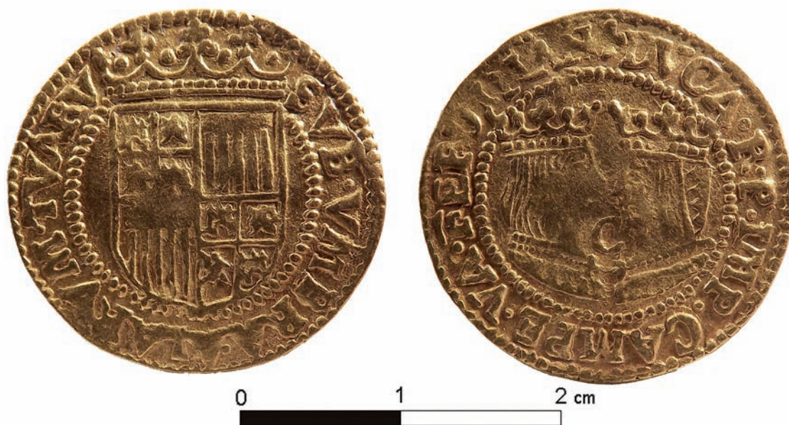
6. kép: Ferdinánd és Izabella arany dukátja a visnyeszéplaki leletből, Hollandia, Kampen