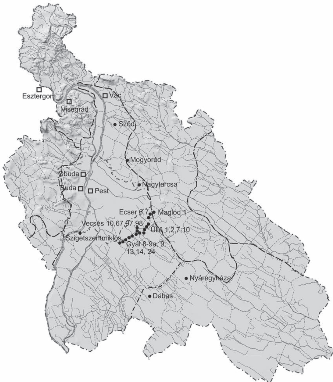
1. kép: Pest megye térképe az elmúlt 15 évben kutatott fontosabb Árpád-kori régészeti lelőhelyekkel. A négyzetek a királyi és egyházi központokat mutatják. (A tanulmány minden térképét Erdi Benedek készítette)

A házak szegényes leletanyaga általában háztartási kerámiából, kevés vas- és bronztárgyból, állatcsontokból tevődik össze. Mindössze Gyál 3. lelőhelyen került elő néhány grafitos anyagú kerámiatöredék és egy mázas bizánci(?) vagy balkáni(?) korsó, amely külföldi eredete és különleges minősége miatt egykori birtokosának kiemelkedő státuszára utalhat. Ez volt az egyetlen az M0-s autópálya 23 Árpád-kori lelőhelyéből, ahol a házaknak deszkapadlója volt, vagy legalábbis ahol sikerült ilyet dokumentálni. 10 A fenti adatok alapján az általunk vizsgált területen fekvő telepnyomok, vagy inkább lelőhelyek egy kivételével azonos helyet foglaltak el a hierarchiában. A társadalmi csoportok írott forrásokból ismert változatossága mintaterületünk régészeti adataiban nem jelent meg.