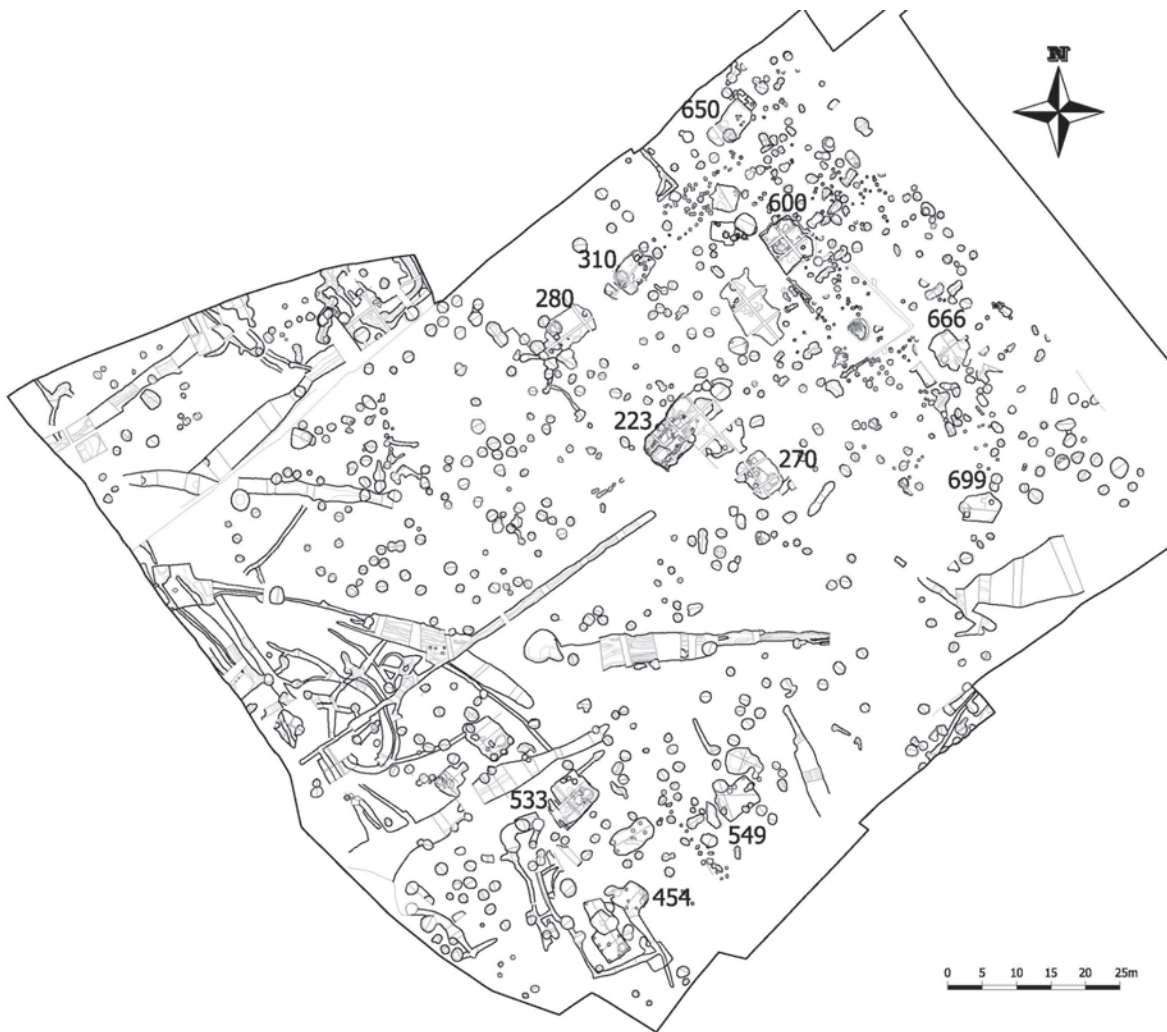
3. kép: Dabas középkori falujának központi magja. A földbe mélyített építmények körülveszik a lelőhely legnagyobb és leggazdagabb építményét (223. objektum)

dás. Megindul a jogilag egységes jobbágság kialakulása is és mindez elősegíti a telkek rögzülését, a települések stabilizálódását. 31 Az agrártechnikai fejlődéssel és társadalmi átalakulással párhuzamosan, a 13. században egy másik lényeges folyamat is lejátszódik: ugrásszerűen megnő a templomok száma és a rögzülő települések hálózata stabil plébániahálózattal egészül ki. A templom lesz a szabályos szerkezetű falu központi építménye, a település magja. Ugyanezt a központosuló folyamatot gyorsítja az egyre erősebb kézművesipari szakosodás, a piacra termelés. Valószínűleg nem tudjuk feltárni azon tényezők összességét, melyek létrehoztak egy-egy települést és determinálták fejlődését. A gazdasági termelői rendszer, a természetföldrajzi adottságok, a meglévő település- és úthálózat voltak talán a legfontosabb formáló erők. 32 Az egyes értékelések során azonban érdemes tekintetbe venni a templom pozícióját és korát, valamint a társadalmi hierarchia lehetséges nyomait is. Mindezek mellett létezhetnek olyan egyéni preferenciák, mint például egy földbirtokos telepítési szempontjai, melyekről részletesebb tájékoztatást nem adhatnak a forrásaink.