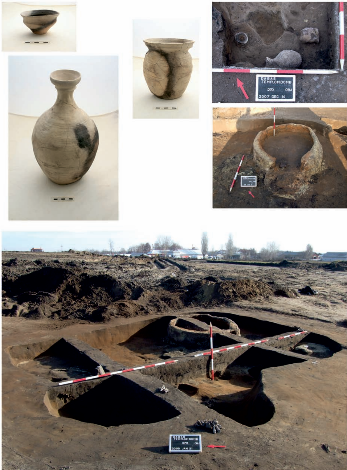
4. kép: Az egyosztatú, földbe mélyített 270. ház fotói és leletei. A padlón in situ találtuk meg a 13-14. század jellegzetes edényeit