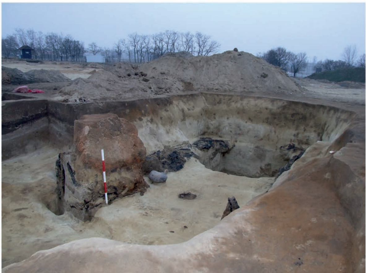
5. kép: A 223. objektum alaprajza és fotói. A pince gödrének hosszanti oldalait deszkaborítás fedte. A nagy alapterületű beásás közepén találtuk meg a szemeskályha omladékát. A vas depóelet és a bekarcolással díszített csonttárgy a betöltésből származik. Andrea Contarini (1367–1382) velencei dózse arany dukátja szórványként került elő a lelőhely területéről