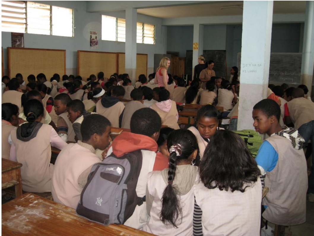
Abb. 2: Unterricht in einer Sekundarschule auf Madagaskar

Es handelt sich hier um eine Schulklasse auf Madagaskar, die in einer Sekundarschule Deutsch lernt und sich auf dem oberen A2-Niveau befindet. Es wird gerade die relativ ungewohnte Gruppenarbeit ausprobiert. Kolleg*innen aus Kamerun, einem Land mit mehr als 200.000 Deutschlernern, wird das Bild vertraut vorkommen. Auch dort gibt es in der Regel extrem große Klassen, in größtenteils allerdings kleineren Unterrichtsräumen. Auch in Asien sind annähernd große Unterrichtsgruppen nicht völlig unbekannt.