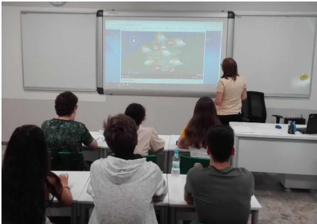
Abb. 3: Vorbereitungsclassse an der Türkisch Deutschen Universität Istanbul

tung gegeben ist, wie sie an vielen Sprachenzentren deutscher Hochschulen keineswegs selbstverständlich ist (Beamer, interaktives Whiteboard, installierte Lautsprecher, durch Rollen für Gruppenarbeit leicht verschieb- und damit umgruppierbare Einzeltische) bleibt festzuhalten, dass z.B. ein gemeinsamer Blick in einen Wikipedia-Artikel unmöglich war, weil in der Türkei der Zugang dafür jahrelang gesperrt war und diese Sperre erst am 20.1.2020 aufgrund eines Urteils des türkischen Verfassungsgerichts aufgehoben wurde. Welche Konsequenzen dies auch (und das ist ja nur ein Beispiel) für das „autonome Lernen“ hat, ist offensichtlich (vgl. hierzu auch Fornoff/Koreik 2020: 61).