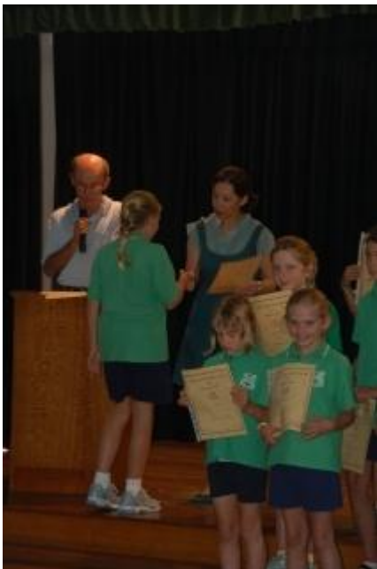
Abbildung 3: Vergabe des Henry Gilbert Smith Award an Migranten- und Nicht-Migrantenkinder

In der Langzeitbeobachtung wurden die Awards in den Schulversammlungen übergeben, und zwar von der Direktorin persönlich (Abbildung 3: links) unter Anwesenheit der Schulgemeinschaft sowie z.T. auch der Eltern. Damit wurden die Leistungen von der höchsten Instanz der Institution geschätzt und für das Kind, die Schulgemeinschaft und die Eltern als solche sichtbar gemacht. Die Auszeichnungen, die für unterschiedlichste Leistungen vergeben worden waren, hatten optisch das gleiche Aussehen (Abbildung 3: rechts). Damit erhielten die Migrantenkinder die Botschaft, dass sie etwas geleistet hatten, was mit den Leistungen der Nicht-Migrantenkinder vergleichbar war.