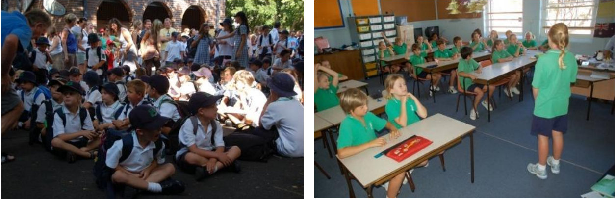
Abbildung 1: Migrantenkinder und Nicht-Migrantenkinder in Schuluniform

Doch die soziale Integration ist keine einfache Aufgabe, weder für die aufnehmende Schulgemeinschaft, noch für das aufzunehmende Kind. Dies belegt die umfassende Studie von Kronig, Haerberlin & Eckhart ( 2 2007) zur Situation von Immigrantenkindern in der Schweiz, wo die soziale Integration bislang nicht zufriedenstellend gelingt. Mit der Schuluniform allein ist es also nicht getan. Es sind weitere Schritte nötig, und blickt man nach Australien, wird deutlich, dass an staatlichen Grundschulen in NSW bereits vieles von dem umgesetzt ist, was Kronig et al. ( 2 2007) aufgrund ihrer Studie für eine verbesserte Situation in der Schweiz fordern. Offenbar hat Australien hier einen Erfahrungsvorsprung: