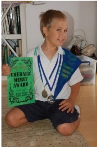
Abbildung 4: Migrantenkinder aus Deutschland nach einem Jahr (links) bzw. nach zwei Jahren (rechts) an einer australischen Grundschule

Zum Konzept gehörte ferner, dass mit den Awards nicht gespart wurde. Die beiden Kinder aus der Langzeitbeobachtung erhielten im ersten Erwerbsjahr 40 bzw. 50 Mini Merits, im zweiten Erwerbsjahr ebenfalls 40 bzw. 50 Mini Merits und im dritten Erwerbsjahr reduzierte sich die Zahl dann auf 30 bzw. 40 Mini Merits. Für die Mini Merits erhielten sie die entsprechenden Auszeichnungen und am Ende konnten sie die Anerkennung für ihre Leistungen in Form von greifbaren Gegenständen in Händen halten und zur Schau stellen (Abbildung 4).