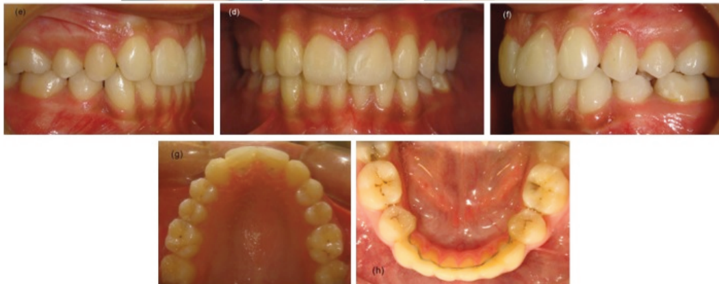
Figure 5. Posttreatment intraoral and extraoral photographs after restorations.