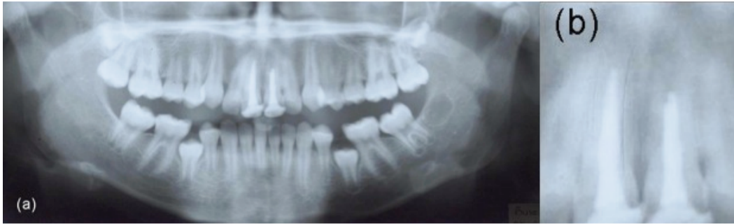
Şekil 2. Tedavi öncesi panoramik ve periapikal radyografiler.