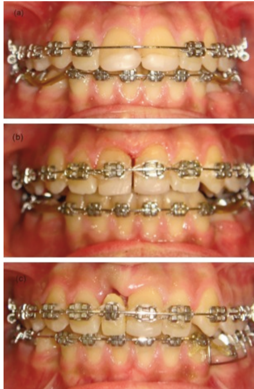
Figure 3. Treatment progress photographs.