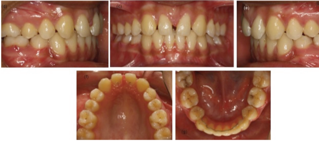
Figure 4. Intraoral photographs after removal of the brackets.

ortodontik olarak kapatılması (6,7) ve protetik uygulamalar mevcut alternatifler olacaktır. Bu vakada, premolarların kök gelişimi tamamlanmış olduğundan transplantasyon için uygun değildi. Implant restorasyonu ise kemik gelişimini tamamlanmadığından uygun bir seçim olmayacaktı (4). Bu tedavi yöntemleri arasında, ortodontik olarak boşluk kapatma