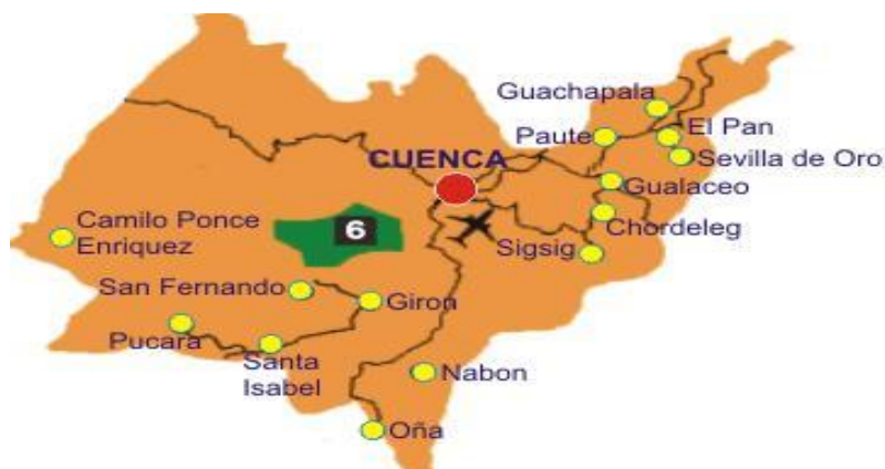
Figura 2. Región del objeto de estudio

Por lo expuesto, el muestreo estratificado permite el análisis de los resultados de cada sector que conforman la población de estudio, y estará en función de la proporción de integración en la muestra, por lo tanto, se supone que las conclusiones basadas en las estimaciones deberán ser más precisas (Lohr, 2000). La técnica del muestreo aleatorio estratificado debe sincronizarse con la información obtenida de las encuestas, sobre la efectividad de esta técnica al tratarse de poblaciones similares o de igual características, es decir que los estudios y posterior resultado deben ser el reflejo de la población total de la región de estudio (fig. 2).