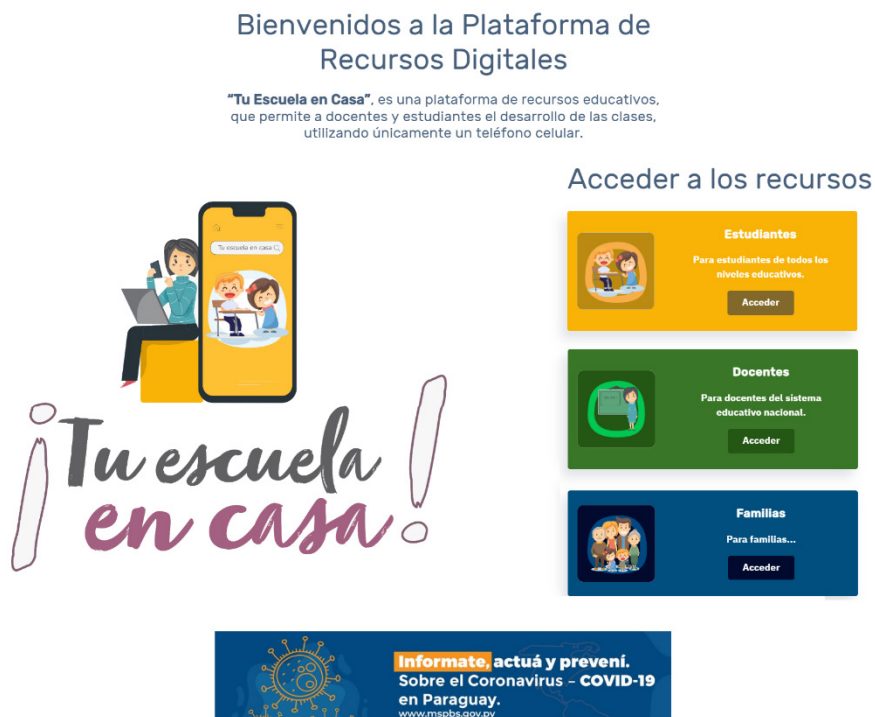
Figura 1 Aspecto de la página inicial del Proyecto TED «Tu escuela en casa» en 2020