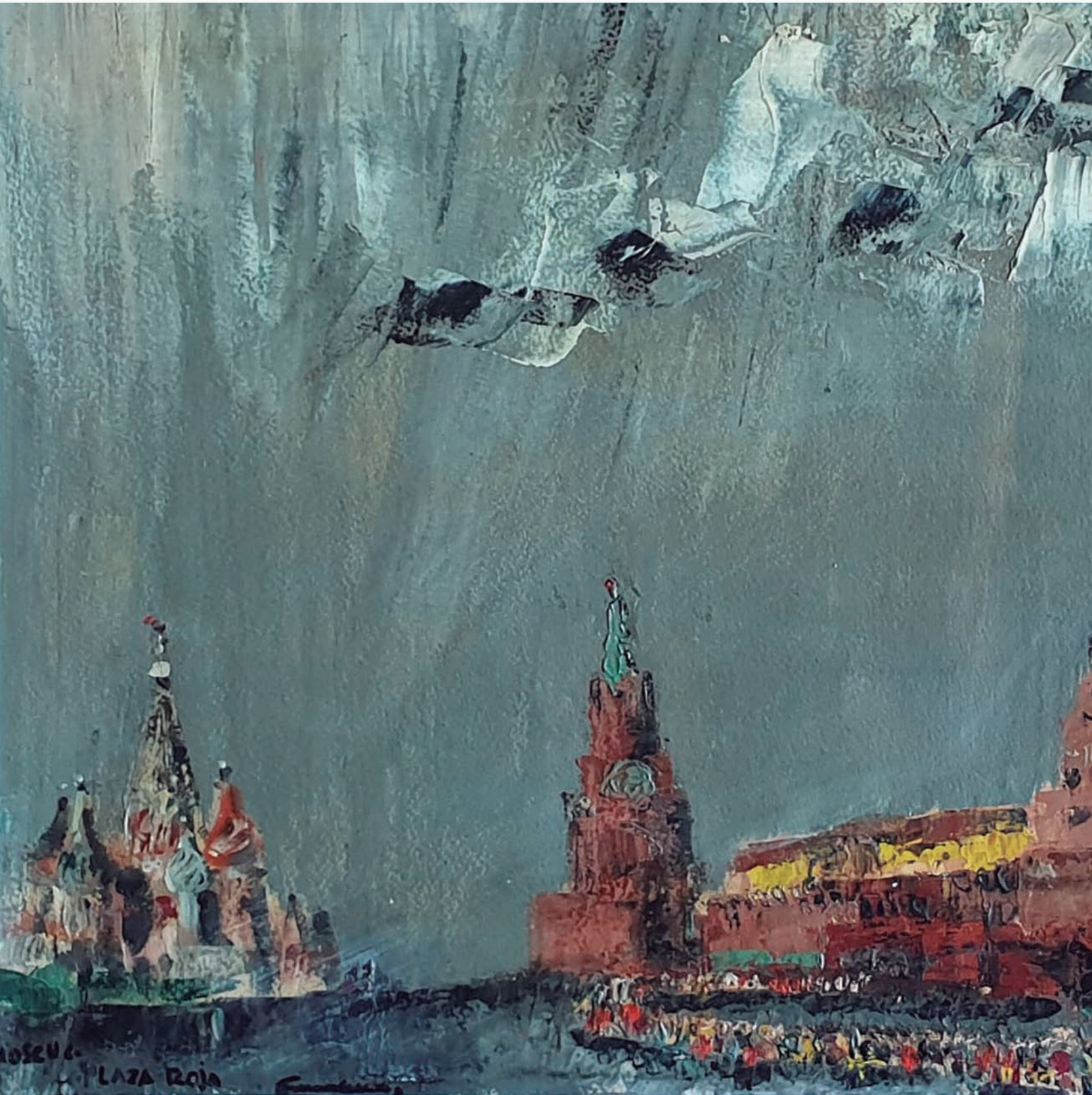
9. Red Square in Moscow in 1960, by Fernando Cavestany. Source: Private archives of Fernando Cavestany's heirs