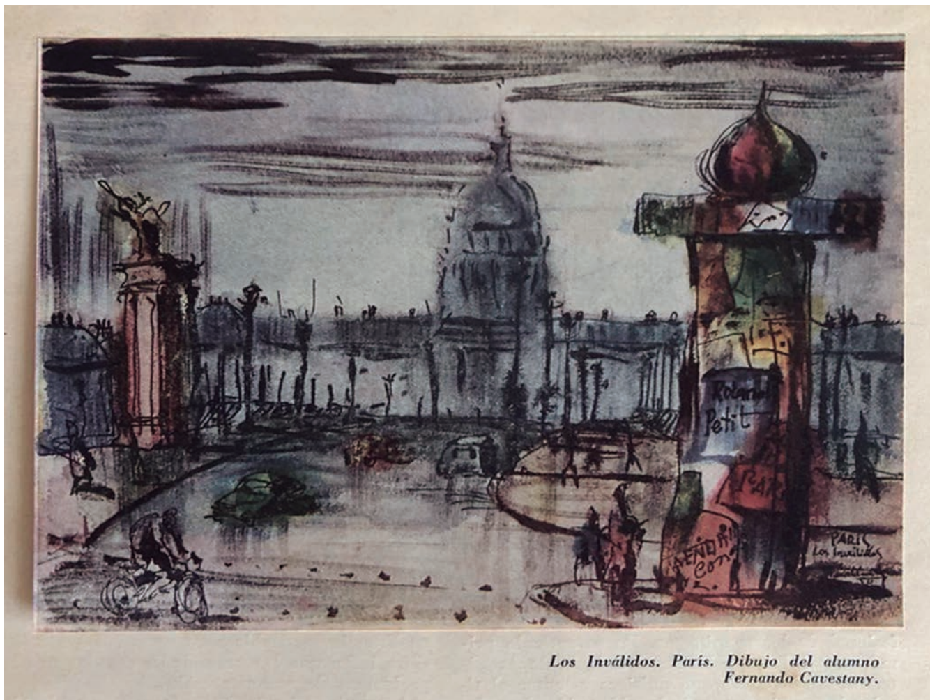
Los Inválidos. París. Dibujo del alumno Fernando Cavestany.