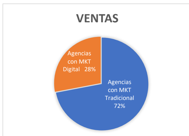
Figura 2: Agencias con marketing digital y tradicional

La figura 1, se muestra que el 80% de los turistas son nacionales y un 20% son extranjeros, lo que determina la demanda turista en las agencias en la ciudad del Cusco, por lo que se generó un incremento en los ingresos, por lo que varias empresas decidieron mejorar la oferta de sus servicios y establecimientos, logrando fidelizar a los clientes. Todo esto generó una incertidumbre en las empresas, ya que el ingreso de divisas internacionales influye significativamente en los ingresos de nuestra localidad. Solo se espera que la reactivación económica sea apresurada y que la llegada de turistas incremente.