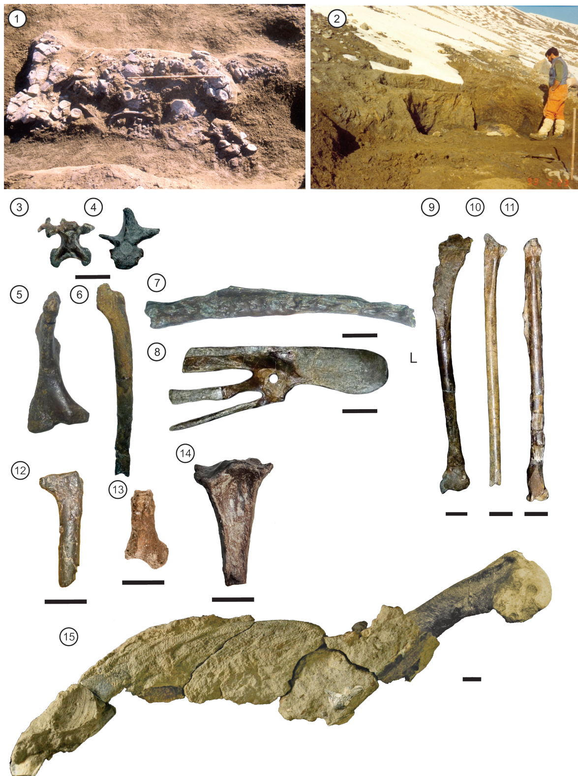
Figura 3. 1, Foto de campo del ejemplar MLP 93-I-5-1 (holotipo Vegasaurus molyi ). 2, Primeras etapas de la extracción de Vegasaurus molyi . 3–14, Vegavis iaai (MLP 93-I-3-1); 3, vértebra cervical en vista dorsal; 4, vértebra dorsal en vista craneal; 5, coracoides en vista dorsal; 6, escápula en vista costal; 7, sinsacro en vista lateral; 8, huesos pélvicos lado derecho en vista lateral; 9, húmero derecho en vista craneal; 10, ulna izquierda en vista ventral; 11, tibiotarso izquierdo en vista caudal; 12–13, fémur izquierdo en vista craneal; 14, tarsometatarso derecho en vista dorsal. 15, Ala del pingüino Palaeudyptes gunnari articulada y con piel mineralizada preservada (MLP 14-I-10-22). Escala= 10 mm.