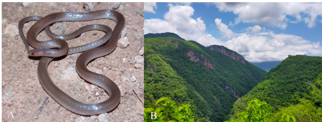
Figure 1. (A) An individual of Enulius oligostichus (IBH-RF 699) from Mineral de Nuestra Señora, Cosala, Sinaloa, Mexico; and (B) the habitat of E. oligostichus characterized by tropical deciduous forest.

Figura 1. (A) Un individuo de Enulius oligostichus (IBH-RF 699) del Mineral de Nuestra Señora, municipio de Cosalá, Sinaloa, México; y (B) panorámica del hábitat caracterizado por bosque tropical caducifolio.