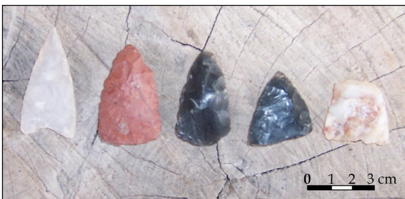
Figura 2: Puntas de proyectil recuperadas en La Maroma, la tercera y cuarta desde la izquierda fueron presentadas en este trabajo.