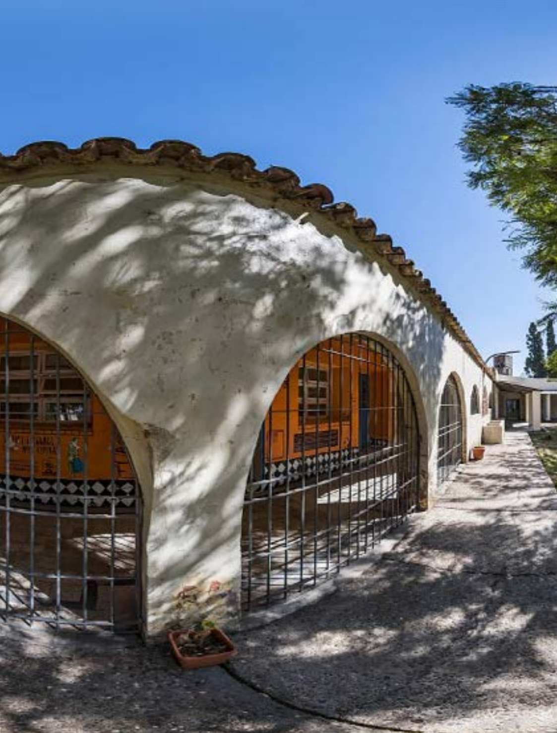
Campo de La Ribera