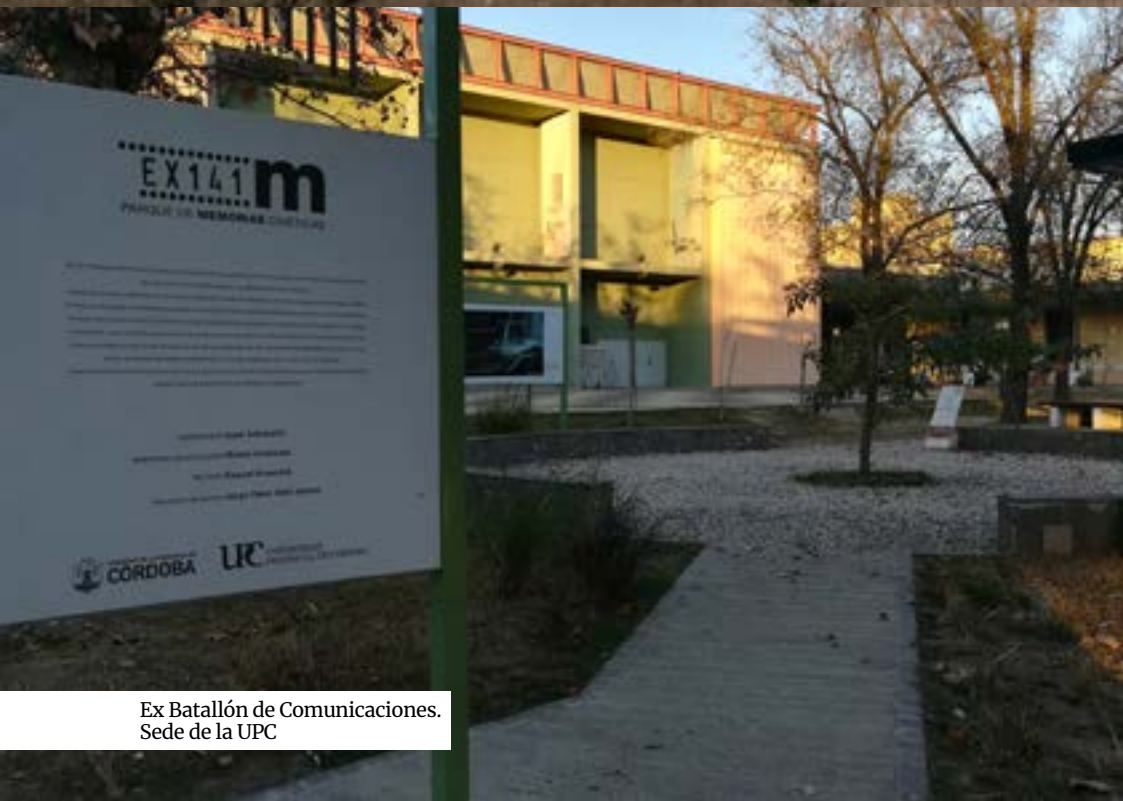
Ex Batallón de Comunicaciones. Sede de la UPC