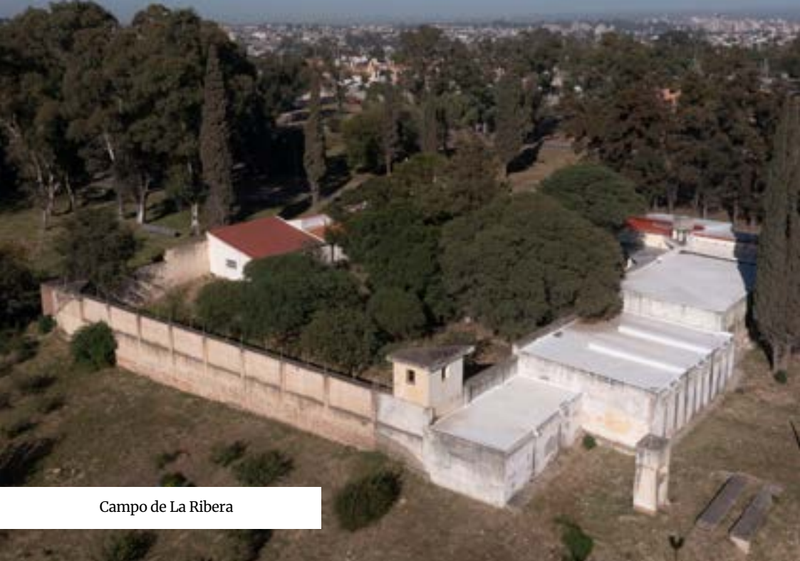
Campo de La Ribera