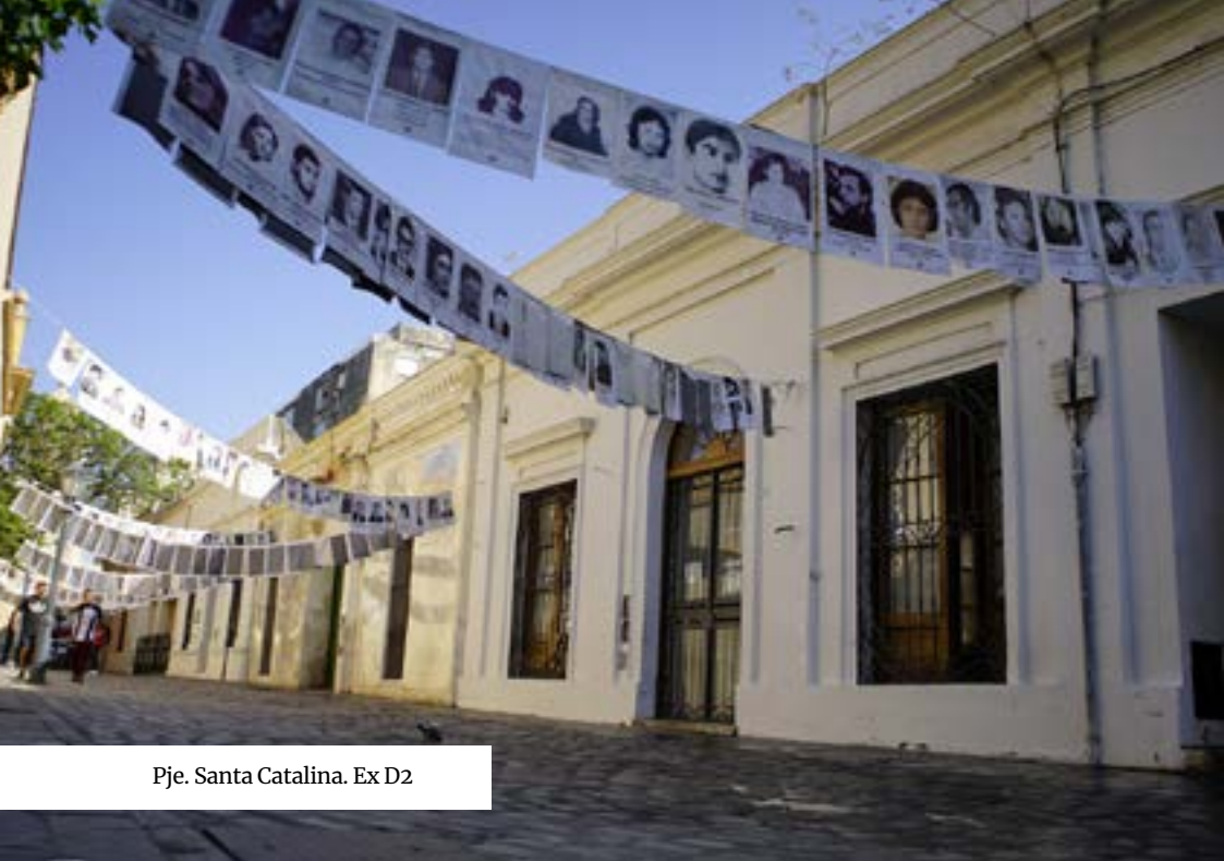
Pje. Santa Catalina. Ex D2