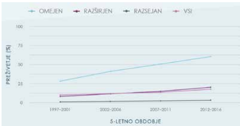
Slika 3. Petletno čisto preživetje bolnikov s pljučnim rakom po stadiju v Sloveniji v letih 1997–2016 (vir: Preživetje bolnikov z rakom, zbolelih v letih 1997-2016 v Sloveniji, 2020)

Petletno preživetje bolnikov, zbolelih v obdobju 2015–2019, je bilo 19,5 %, bolnic pa 26,4 %. Glede na razširjenost bolezn ob diagnozi je petletno preživetje skupine bolnikov z omejeno boleznijo v zadnjem obdobju preseгло 60 %, medtem ko je pri bolnikih, odkritih z lokalno razširjeno ali razsejano boleznijo, petletno preživetje še vedno v povprečju manjše od 20 % (Slika 3).