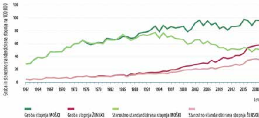
Slika 1. Incidenca pljučnega raka med leti 1961 – 2019 (vir: Register raka Republike Slovenije, 2022)

Največ zbolelih za pljučnim rakom je bilo leta 2019 pri obeh spolih v starosti 60–75 let. V tej starostni skupini zboli skoraj 60 % vseh zbolelih za pljučnim rakom. Pomemben je tudi delež zbolelih starejših od 75 let, ki je presegel 28 %.