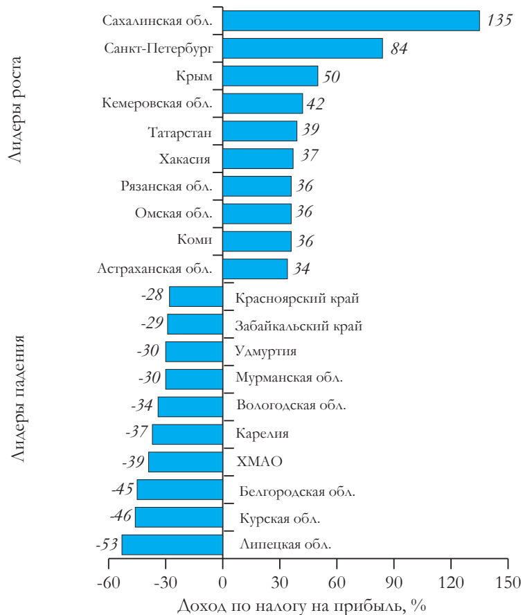
Рис. 1. Регионы-лидеры по росту и падению совокупных доходов бюджета

Составлено автором по материалам источника [5]