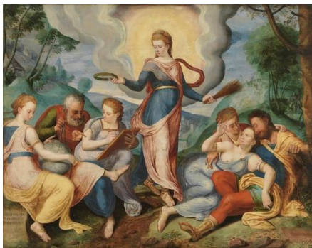
Рис.5. Франс Флорис. Аллегория награды за добродетель и наказания за порок. Ок. 1560-1570 гг. Старая Пинакотекa

Точность в деталях и общий план композиции гравюры наиболее близки к иллюстрациям «Корабля дураков» и выполнены в рамках северной маньеристической традиции, что неслучайно: становление ван ден Брока как художника проходило в мастерской Франса Флориса, одного из самых ярких мастеров нидерландского романизма. Обнажённые тела, увиденные не с натуры, а скорее почерпнутые из живописи и печатной графики, а также карабкающиеся вверх люди, напоминающие о «Страшном Суде» Микеланджело, соседствуют с демонами, сошедшими с картин Босха. Возможно, на идею сюжета, предполагающего выбор между трудолюбивым усердием и земными наслаждениями, повлияла картина Флориса «Аллегория награды за добродетель и наказания за порок», где занятия свободными искусствами противопоставлены плотскому удовольствию (рис.5). Кроме того, облако и солнечный шар, на фоне которых выступает центральная фигура, повторены в композиции фламандского рисовальщика.