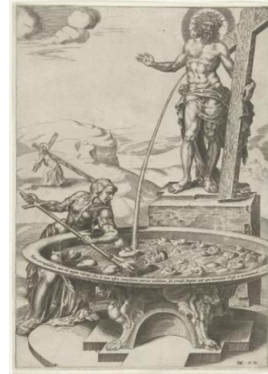
Рис.17. Дирк Волкертсзон Корнхерт по рисунку Мартена ван Хемскерка. Вера очищает сердца людей кровью Христа. 1557 - 1561 гг. Рейксмузеум