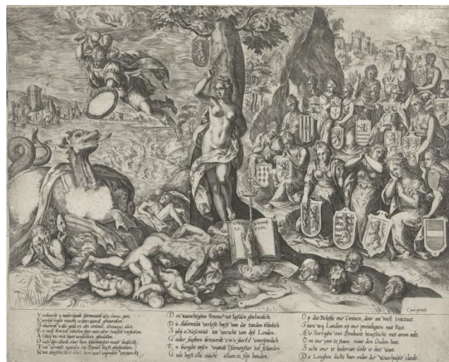
Рис.9. Ян Вирикс по рисунку Кристина ван ден Брока. Вильгельм Оранский спасает Нидерланды от испанского морского чудовища. Ок. 1577 г. Рейксмузеум

Та же семантическая связь между героем-освободителем и гидрой империи Габсбургов представлена на другой гравюре по рисунку ван ден Брока (рис.9): политическая аллегория изображает Вильгельма Оранского, защищающего Нидерланды, в образе Персея, спасающего Андромеду, прикованную к дереву. Её жизни угрожает морское чудовище, олицетворяющее испанскую тиранию, в то время как аллегории нидерландских провинций в виде молодых женщин с гербами в руках ожидают спасения на другом берегу. Можно с уверенностью сказать, что как художник и гражданин Кристина ван ден Брок был заинтересован в изображении пороков тирании и героических добродетелей 19 . Важно отметить, что в брошюре ван Хехта тираноборцы изображены как триумфаторы: победа над врагом показана на гравюрах как уже свершившаяся. А в случае с изображениями и памфлетами, отсылающими к героизму Вильгельма Оранского, спасение приходит извне. Кажется, что политическая пропаганда в ситуации испанского вторжения не столько стремится наделить зрителя волей к сопротивлению, сколько отсылает к человеческой способности терпения и ожидания: все тираны рано или поздно заканчивали плохо, а герой-тираноборец оказывался рядом в нужный момент. В политическом пространстве более нет места для гражданского подвига, гражданина здесь вытеснит суверен. Нам ясно, о чём должен думать бюргер, но какие действия он должен предпринимать в условиях кризиса?