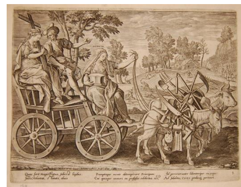
Рис.15. Адриан Колларт по рисунку Мартина де Воса. Призвание рабочего класса. Ок. 1585 г. Британский музей

Одной из попыток вписать класс бюргеров в социальную архитектуру трёх сословий можно назвать серию гравюр Адриана Колларта по рисункам Мартина де Воса – довольно крупных представителей южнидерландской школы рисунка. Серия изображала представителей трёх сословий в распространённой иконографии триумфальных колесниц, причём главной особенностью гравюры, посвящённой народу, является попытка объединить образы крестьянства, бюргерства и ремесленников (рис. 15). Так, горожанин возвышается на простой деревянной повозке рядом с аллегорией Послушания с крестом в руках, а значит примерный бюргер, прежде всего, послушен воле вышестоящих: от Бога до земных правительств. В качестве извозчика выступает Терпение с наковальней в руках. Чем содержательно наполнена жизнь бюргера? Повозка запряжена быком, символизирующим труд, и худым осликом, означающим упорство, каждый из которых нагружен рабочими инструментами. Важный нюанс: среди последних присутствуют кисть и палитра, а значит рисовальщик и гравёр как члены гильдии святого Луки причисляют себя к кругу горожан, жизнь которых наполнена терпеливым, усердным, постоянным трудом вне зависимости от специфики профессии. Картину этого секулярного варианта праведности завершает пейзаж, в котором крестьяне заняты обработкой земли. Образ далёк от идиллии: он не воодушевляет, но недвусмысленно предписывает должное поведение.