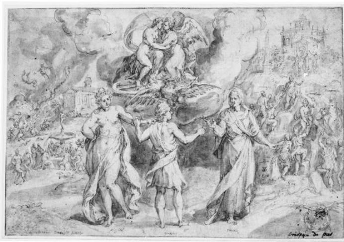
Рис.1. Кристина ван ден Брок. Геркулес на распутье. 1576 г. Фонд Кустодия, Париж

Однако в XVI веке, на заре новой эпохи, идеи классического гуманизма, столкнувшись с немислимой прежде политической реальностью, не могли не претерпеть серьёзных трансформаций. На фоне жесточайших религиозных конфликтов и затяжных войн с Империей, начала процесса переплавки королевских доменов и свободных городов в государства Нового Времени главной чертой эпохи становится зыбкость мировоззренческих оснований, прежде казавшихся онтологически фундаментальными: человек обнаруживал себя в странном неустойчивом положении между старыми идеалами трёх сословий и первыми проявлениями новой культуры, буржуазной и придворной. Образ республиканского Геркулеса, скрепляющего civitas , не мог быть исключением. Красноречивым примером поиска опоры в неустойчивом мире нарастающих кризисов является гравюра «Геркулес на Распутье» Яна Вирикса, выполненная по рисунку Кристина ван ден Брока, отмеченная появлением принципиально новых смыслов (рис.1-2).