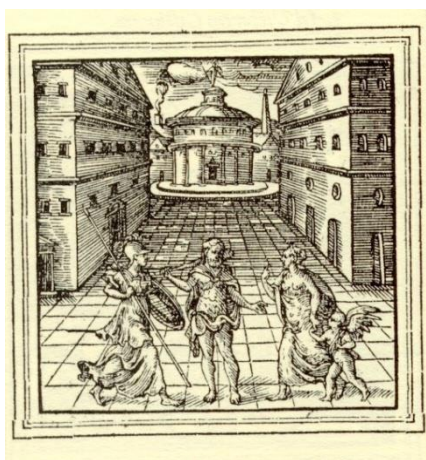
Рис.3. Адриан Юниус. Эмблемата. Бывшая мастерская Кристофора Плантена. Эмблема XLIV. 1565

Рисунок и гравюра являются типологически близкими как к более ранним итальянским изображениям, так и к упомянутым письменным источникам, однако здесь появляются два существенных изменения. Во-первых, изящной и привлекательной фигуре Удовольствия противостоит не Virtus , а Labor (Труд) – соответствующая подпись присутствует как на рисунке, так и на гравюре. Во-вторых, персонификация Добродетели не уходит бесследно – она перенесена на верхний уровень композиции над головой Геркулеса и составляет одну смысловую пару с Фортуной. Отступления от иконографии в силу строгости композиционного построения кажутся не случайной ошибкой, а сознательным замыслом художника.