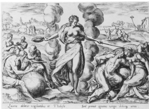
Рис.14. Иероним Вирикс по рисунку Мартина ван Клеве. Награда усердия и наказание лени. Вторая половина XVI в. Королевская библиотека Бельгии

Однако процесс этот протекает постепенно, переходный характер эпохи виден и в том, как плавно размываются сословные границы: ещё не вполне ясно, куда вписать стремительно растущее городское население, отчасти совпадающее с кругом лиц, участвующих в создании и потреблении печатной продукции. Активные издатели, торговцы, ремесленники, а также учителя, врачи и юристы уже ставили под сомнение представление о легитимности сословной системы, однако ещё не разрушили её. На первых порах для жителей крупных городов вопрос состоял в том, какой образ жизни стоит вести тем, кто зарабатывает на жизнь собственным трудом.