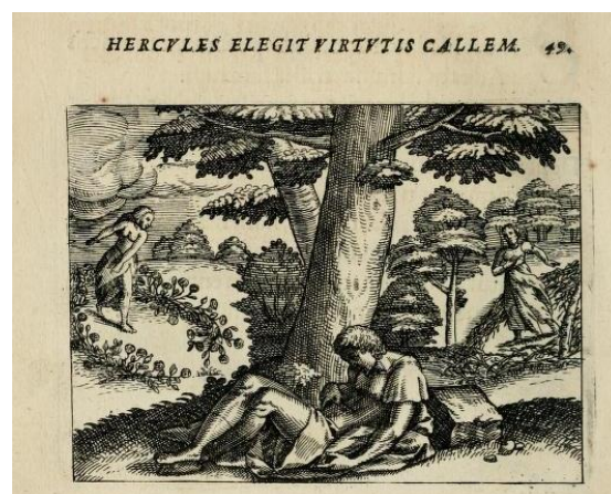
Рис.4. Лаврентий Гихтан. Микрокосмос: Паруус мундус. Эмблема 49. 1579