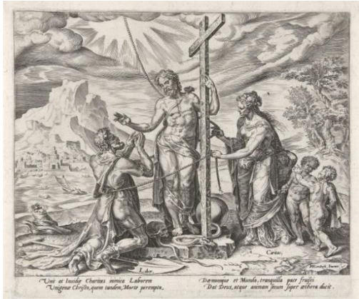
Рис.16. Филипп Галле по рисунку Мартена ван Хемскерка. После смерти труд вознаграждается любовью Христа. 1572 г. Рейксмузеум

что вниманию зрителя представлена нелёгкая работа ведьмы, вынужденной сварить целый котёл сердец не в переносном смысле. Вера здесь трудолюбива, а труд религиозен.