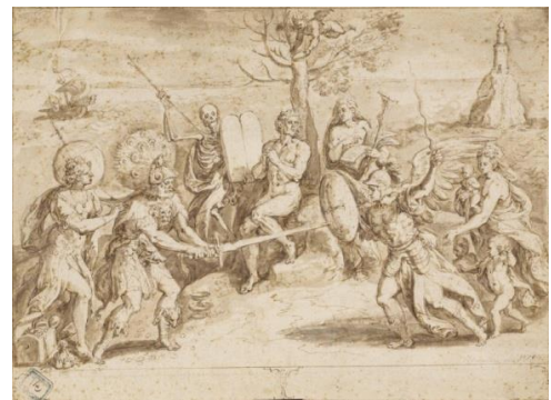
Рис.6. Криспин ван ден Брок. Выбор между Духом и Плотью. 1576 г. Частная коллекция