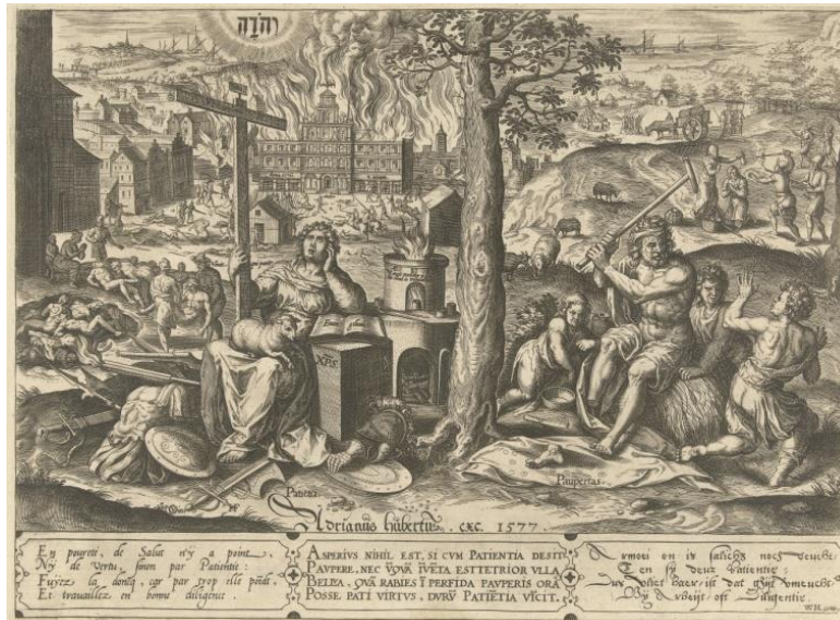
Рис. 7. Ян Колларт Ст. по рисунку Кристина ван ден Брока. Терпение в невзгодах. 1577 г. Рейксмузеум

Терпения ( Patientia ), окружённая доспехами и оружием, а также крестом, Библией и Агнцем, соседствует с персонификацией Бедности ( Paupertas ) в виде нищего калеки, и обе фигуры расположены на фоне ужасов войны. Место действия опознаётся безошибочно благодаря изображению антверпенской ратуши, охваченной пламенем. Для будущих рассуждений важно отметить, что фигура Терпения обращает взгляд, исполненный страдания и надежды, на тетраграмматон, характерный для кальвинистской визуальной культуры 15 . Гравюра несёт ясно считываемое моральное и политическое послание, призывая современников к благочестивому терпению, позволяющему пережить вызванные войной ужасы, среди которых на передний план выдвигается не смерть, не рабство, не гнев, а Бедность – характерный ценностный выбор для процветавшего торгового города. Стихи ван Хехта, сопровождающие гравюру, также призывают читателя к усердию ( Diligentia ).