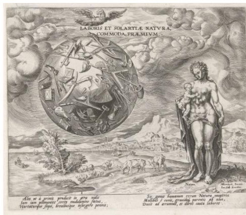
Рис.18. Филипп Галле по рисунку Мартена ван Хемскерка. Человек рожден для труда. 1572 г. Метрополитен-музей

как ранее она вскормила птицу для полёта. Аллегория хорошо иллюстрирует культурную ситуацию времени: труд здесь становится атрибутом и уделом не отдельного сословия или конкретных персонажей, а человечества как такового. Новый тип мышления открыл человека не как носителя определённой культуры, а как представителя всего человечества , населяющего земной шар. Действительно, что может быть общего между крестьянами, королями, священниками, художниками, аборигенами Нового Света, жителями Антверпена и Лондона? Общего не в значении единого и едва ли достижимого идеала, а общего фактически – какая характеристика формально подошла бы каждому? Человечество объединяет тривиальная необходимость предпринимать усилия для поддержания жизни, то есть трудиться.