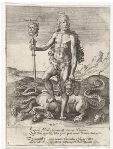
Рис.8. Иероним Вирикс по рисунку Кристина ван ден Брока. Геркулес. 1578 г. Рейксмузеум