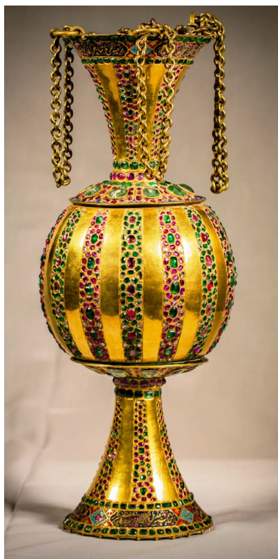
تصویر ۱ قندیل طلا شماره ۱۰۱۷

این قندیل، مسی با روکش طلا و مرصع و جواهر نشان می باشد (تصویر شماره ۱) متعلق به دوره قاجاری - قرن سیزدهم هجری قمری - واهدائی فتحعلی شاه قاجار است. این قندیل جزئی از مجموعه موقوفات اهدایی فتحعلی شاه قاجار به آستانه مقدسه به تاریخ ۱۲۴۲ شمسی است.