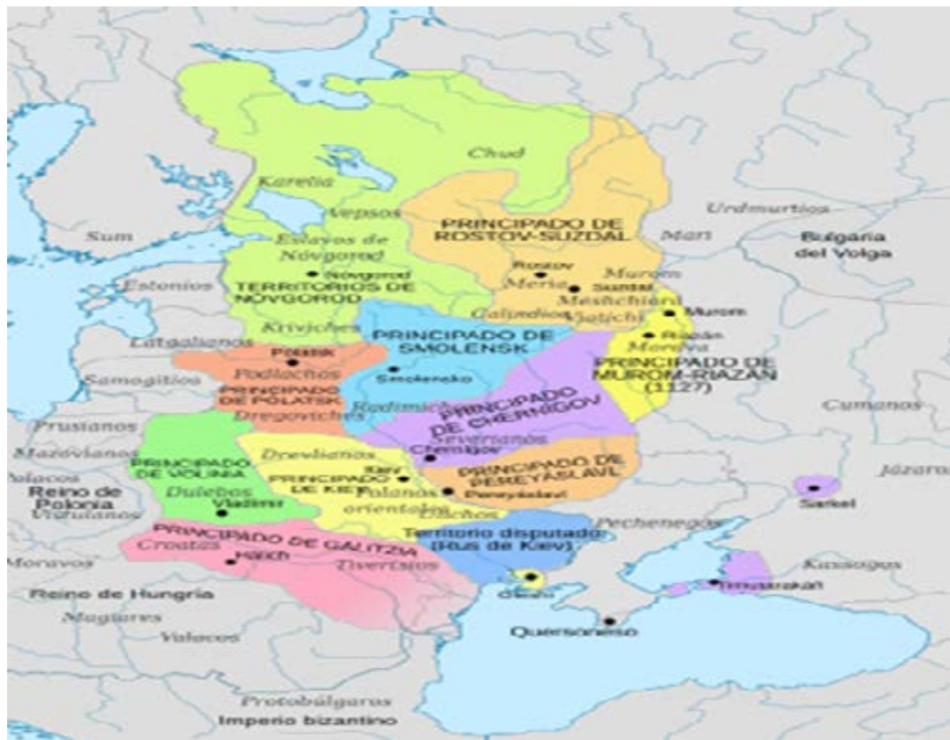
Fig. 1 Principados de la Rus de Kiev 1054-1132 (no está indicada Moscú ya que fue fundada en 1147 aproximadamente)

Entre las principales aportaciones de la Rus de Kiev está la introducción de la variante eslava del culto ortodoxo, profundizando aún más la síntesis de culturas bizantina y eslava que definiría a la rusa durante los siguientes mil años. La traducción de