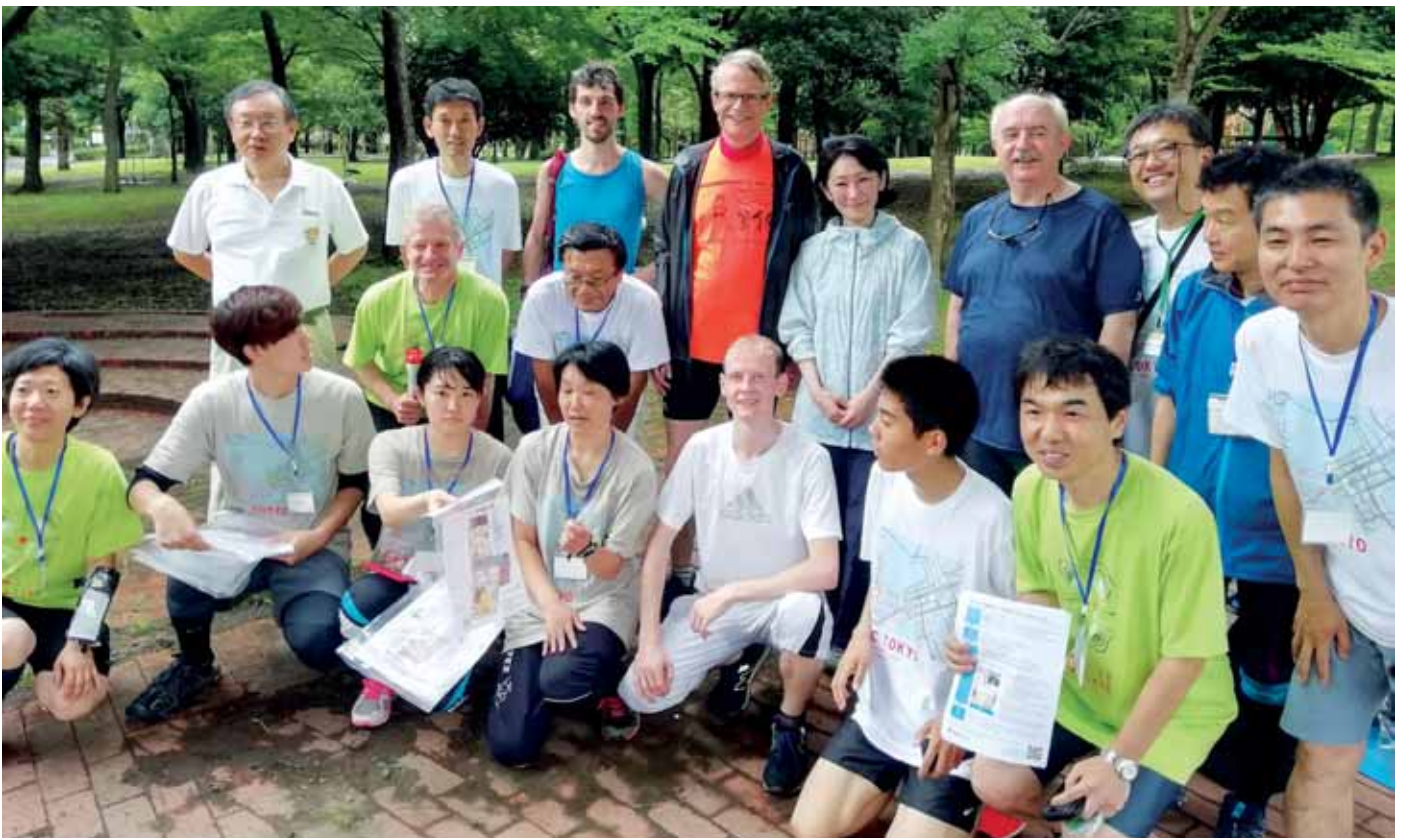
Uitblazen na de oriënteringsrun in Tokio.

ringen: je bent continu in de weer, altijd alert, je moet van alle onderwerpen iets weten en er een mening over hebben. Uiterst intensief. Na drie dagen ben je gesloopt. Ik ben er