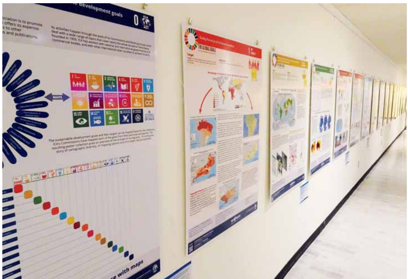
Posterwand bij VN in New York. SDG's zijn zichtbaar op de kaart.

En nu, hoe verder? "Nu eerst met sabbatical, maar het blijft zoals ook in het vorige interview vermeld 'never a dull moment'. Eerst nog wat bijeenkomsten in Europa. Sabbatical tot maart 2020. En onderwijl druk met twee boeken. Nog vier jaar past-president van ICA, en daarin nog steeds wat rollen, waaronder nog steeds de UN-vertegenwoordiger. Dan nog twee jaar hoofd van de afdeling. Nog vijf jaar tot zijn pensioen. Daarna moet een ander hoogleraar het stokje overnemen.