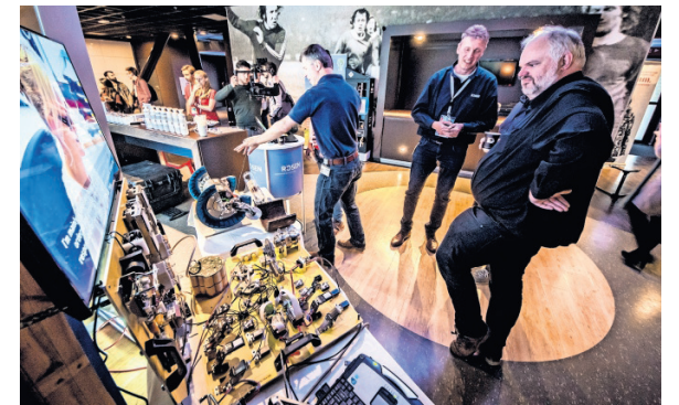
▲ Bezoekers van Today & Beyond kijken wat de firma Rosen te bieden heeft.