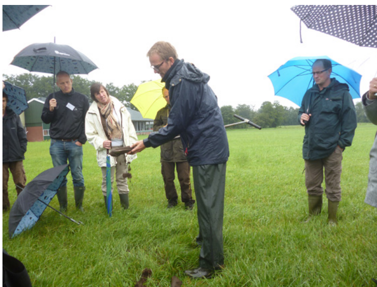
Afbeelding 3: Tijdens een bezoek van Somerset aan Twente in september 2013 wordt een grondmonster genomen om de grondwaterstand te bepalen

Vechtstromen en Somerset staan beide voor de uitdaging om het waterbeheer zowel voor natuur als landbouw goed in te richten. Opvallend hierbij is dat de scheiding tussen landbouw en natuur in Nederland heel scherp is. In Engeland worden natuurbeheer en landbouw veel vaker gecombineerd. Droogte wordt in Nederland ook grootschaliger aangepakt, terwijl men het in Engeland veel meer in kleine oplossingen zoekt. Een ander verschil is dat de overheid in Engeland een kleinere rol heeft in het waterbeheer. Belangengroepen en boeren hebben een relatief grotere rol bij het verminderen van droogte. Ook zijn er verschillen in kennis en expertise. In Nederland heeft men meer ervaring met het herstel van veengebieden terwijl men in Engeland meer kennis heeft van bodemverdichting.