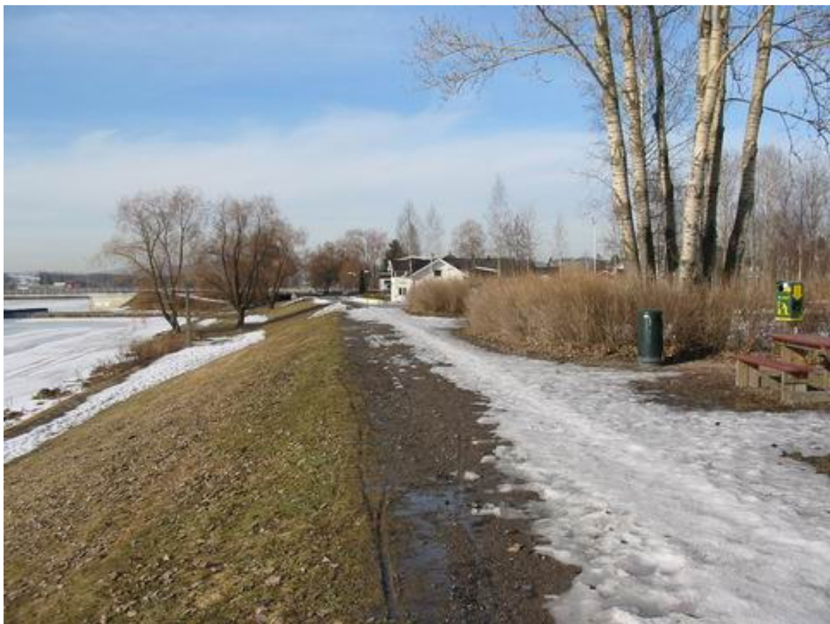
Lillestrøm (Noorwegen), maart 2003. Hier is na de laatste overstromingen een dijk aangelegd. Het planproces heeft zo lang geduurd, dat compromissen nodig waren om tot een “gewenste eindoplossing” te komen. Ter plaatse van een beperkt aantal woningen is de dijk verlaagd, zodat het uitzicht over de rivier Nitelva behouden kon worden.

In het Interreg 3b project “Flows” gaan Engelsen, Noren, Zweden en Nederlanders gezamenlijk op zoek naar een gezonde ruimtelijke strategie voor het omgaan met veiligheid en water. Daarbij wordt niet alleen naar risico’s gekeken, maar ook naar risicopercepties. De in het kader weergegeven S-curve vormt daarbij een belangrijk vertrekpunt. Risico’s en risicopercepties moeten meer met elkaar in overeenstemming worden gebracht. Dat vraagt naast technische ingrepen om veel communicatie. Veiligheid is niet een optimum dat eenmalig wordt bepaald, maar een tijdelijke waarde in een immer doorlopend proces. We staan aan het begin, maar weten nu reeds dat bewoners en verzekeraars naast de huidige actoren een belangrijke rol gaan spelen.