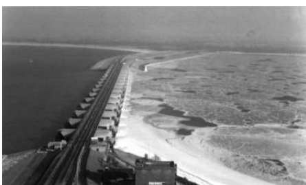
De Haringvlietsluizen in de winter. De openingen moesten breed zijn — en daarom de nabla-ligger heel sterk — met het oog op eventuele ijsgang, maar die heeft zich in de praktijk nooit voorgedaan.

De revolutie op dit terrein kwam echter van buiten. De UNESCO had een groot plan ontwikkeld om het water in de delta van de Mekongrivier het gedeelte in Vietnam en Cambodja beter te beheersen. Dit zou mogelijk worden door het meer Tonle Sap in Cambodja als opslagreservoir te gebruiken. Het doel was zowel overstromingen te voorkomen als de voedselproductie te verhogen. Een aanzienlijke opschudding ontstond in de waterloopkundige wereld toen UNESCO de opdracht om