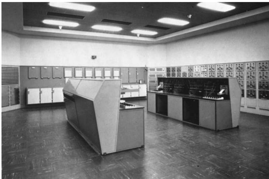
De DELTAR, de analoge rekenautomaat voor de Deltawerken.