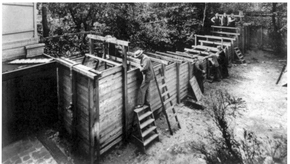
Een zeer vroege voorloper van het klapclub-onderzoek. Rijkswaterstaat bouwde in 1920 in de tuin van een van haar Haagse gebouwen een modelgoot om de golfploop te meten.