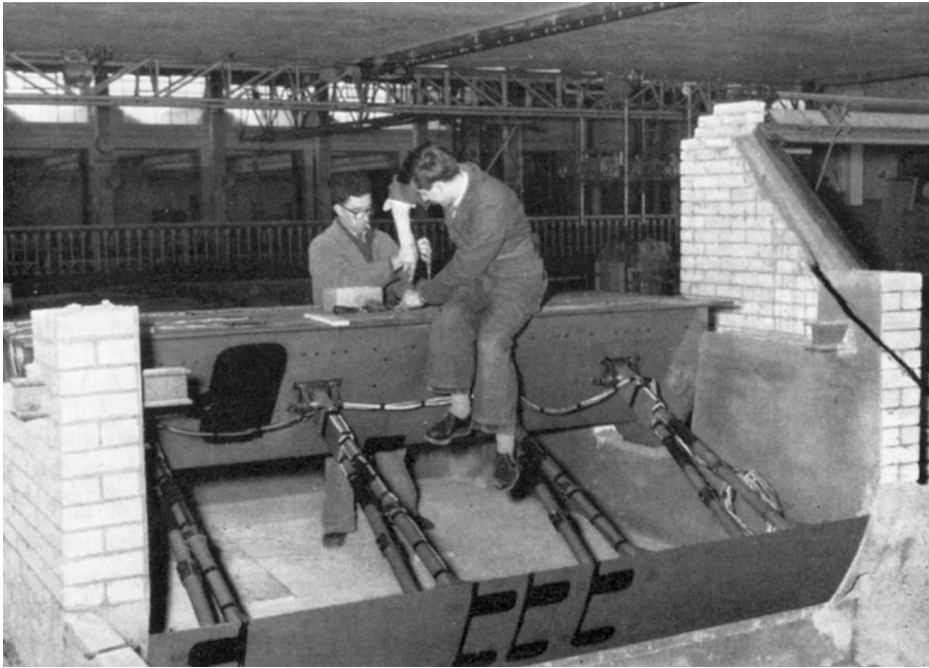
Schaalmodel van de Haringvlietsluizen in het Waterloopkundig Laboratorium in De Voorst. De ingenieur zit op het model van de nabla-ligger.