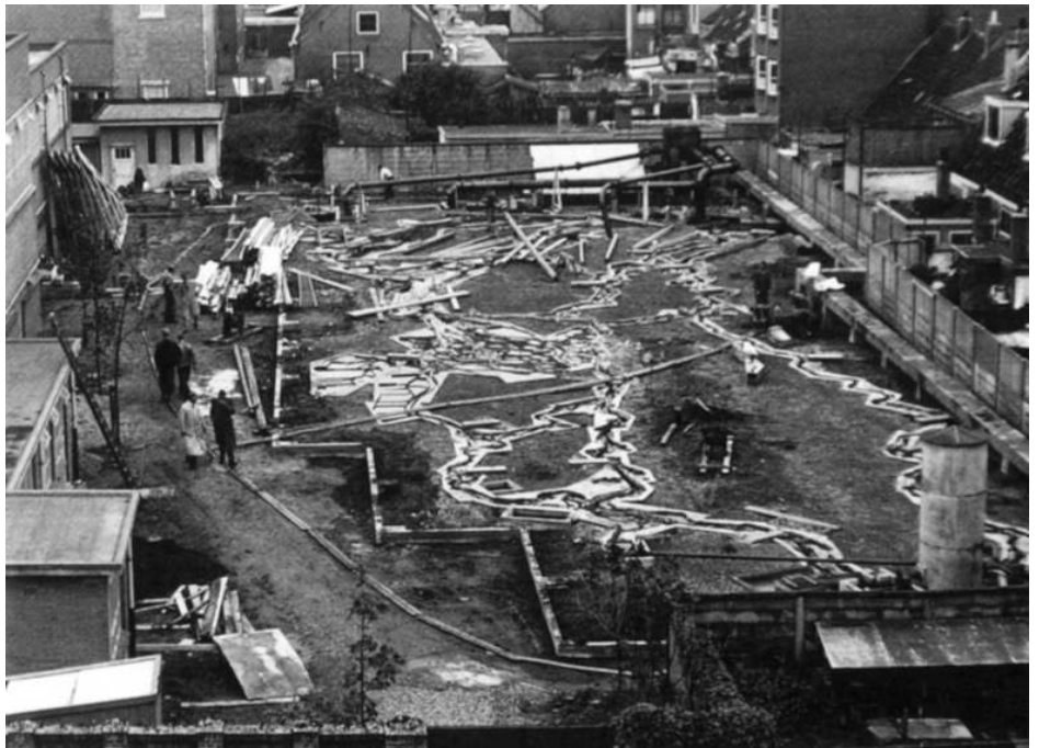
Het Waterloopkundig Laboratorium was aanvankelijk midden in Delft gevestigd. Hier tussen de achtertuintjes het model van de benedenrivieren.

Ook Rijkswaterstaat zelf entameerde onderzoek. De vorming in 1929 van de Studiedienst van de Zeearmen, Benedenrivieren en Kusten van Rijkswaterstaat had weliswaar een andere achtergrond dan de Staatscommissie Lorentz, het succes van deze commissie maakte het de minister van Waterstaat ongetwijfeld gemakkelijker zo'n studiedienst in te stellen "ter verkrijging van volledig inzicht in het mechanisme van de getijwateren". Binnen de studiedienst begon ir. Johan van Veen in 1929 met onderzoek naar verzanding en zandverplaatsing, maar al spoedig verbreedde de aandacht zich naar getijbeweging, zandhuishouding en bedijking. Van Veen ontwikkelde een eigen rekenmethode die hem tot de man van de elektrische analogons zou maken. Dat we elektriciteit als 'stroom' aanduiden heeft zijn oorsprong in de vloeistof-metafoor voor dit eertijds relatief onbekende verschijnsel. Nu kon men natuurlijk de metafoor in omgekeerde richting bewandelen en dit liet zich zelfs concretiseren tot het gebruik van elektrische circuits om waterstromen te beschrijven. In plaats van zich rekenwerk op de hals te halen, mat men aan een plaatsvervangend materiaal. Klassiek geworden is het gebruik van elektrisch geleidend papier als analogie voor grondwaterstroming voor tweedimensionale stromingstoestanden in een homogeen grondpakket. De analogie is erop gebaseerd dat we aannemen dat beide processen zich laten beschrijven met een potentiaal-(Laplace)vergelijking. Zodra er complicaties