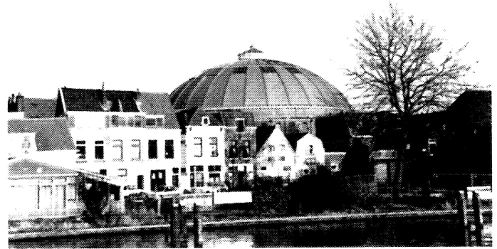
De koepelgevangenis van Haarlem

achterkant van het complex. Voorbijgangers en bezoekers zullen daarom even moeten zoeken voordat zij de ingang hebben gevonden. Het idee van verstopte deuren vinden we terug naast de portiersloge: de deuren voor goederenaafgifte en arrestatiewagens zijn bijna onzichtbaar doordat zij van hetzelfde materiaal (ook hier ogenschijnlijk grote, zware stenen) zijn gemaakt als de muur waarvan zij deel uitmaken, reden voor sommigen om te spreken van 'Sesam Open U-deuren'. 'Als je er niet makkelijk uit kan, moet je er ook niet makkelijk in kunnen', vond Weeber. Bij veel andere nieuwe inrichtingen is de toegang wel de kop van het gebouw, maar lijkt deze nog het meest op de entree van een kantoor of ziekenhuis. 9 In de inrichting in Zoetermeer is de toegang bij voorbeeld opvallend open: een hekwerk, dat uitnodigend openstaat, vormt de toegang tot de ontvangstruimte waar bezoekers worden geregistreerd en gecontroleerd. De poortgebouwen van de nieuwe gevangenissen wekken, door hun onopvallende en open karakter, de indruk dat de ware aard en functie van het gebouw dat zij ontsluiten moet worden verborgen of verhuld.