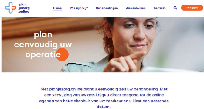
Afbeelding 2 Planjezorg.online

Op dit moment worden overal plannen gemaakt rondom spoedzorg, zo ook in de regio IJmond rond het rKZ 21 . Deze regionale afspraken zouden niet alleen over spoedzorg moeten gaan maar ook over planning en capaciteit van electieve zorg. Een platform waarop capaciteit inzichtelijk wordt gemaakt, kan dan enorm helpen. Voorbeeld: een verder gezonde man heeft last van een zwelling in zijn lies. De huisarts denkt aan een liesbreuk en verwijst de patiënt naar een chirurg. Samen besluiten ze tot een operatie. De patiënt moet - na een afspraak bij de anesthesist op het spreekuur - wachten op een operatiedatum. Nu zijn in de