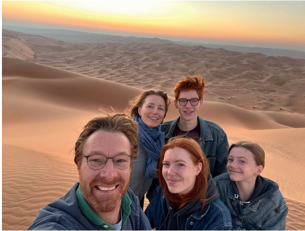
Afbeelding 8 Selfie on the moon