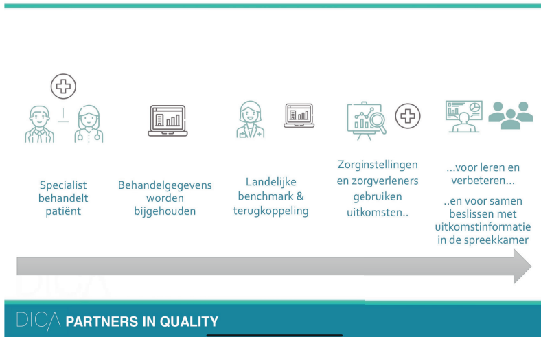
Afbeelding 4 DICA kwaliteitscyclus

Welke invloed hebben netwerkvorming en digitalisering van processen op kwaliteit van zorg, en op kwaliteit van leven? Die vraag kun je alleen beantwoorden als je kwaliteit kan meten en dat is wat kwaliteitsregistraties doen.