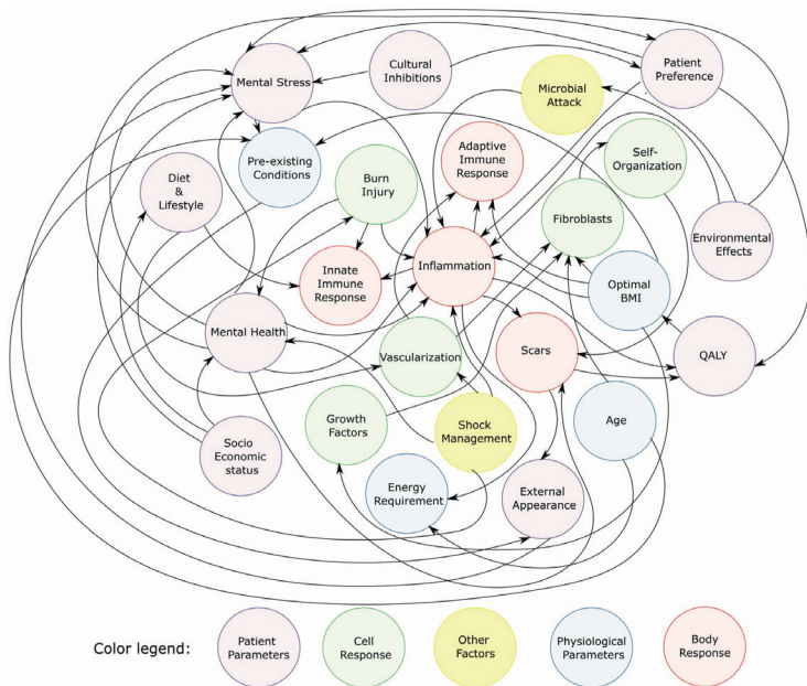
Afbeelding 3 Complexiteit van factoren...

aangedane deel van de huid, maar ook op orgaansystemen, het functioneren van de patiënt en de plek van die patiënt in de maatschappij. En omgekeerd heeft de inrichting van de maatschappij invloed op de gezondheid van mensen 28 29. De verplaatsing van zorg naar complexe hybride netwerken heeft consequenties voor kwaliteitsbeleid en de manier waarop we innovatie in de zorg aanvliegen.