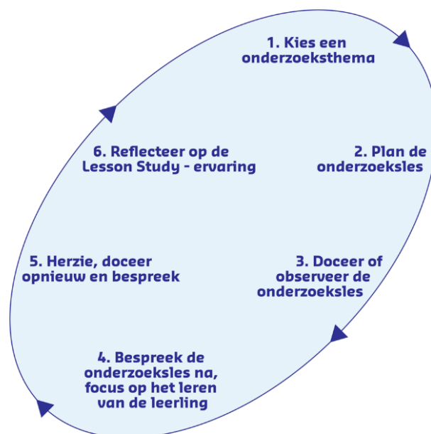
Figuur 1: Fasen van LS (De Vries et al., 2016)

LS is een professionaliseringsaanpak waarbij een klein team leraren de eigen lespraktijk op een systematische manier onderzoekt (De Vries et al., 2017). Op basis van een leerprobleem dat wordt ervaren door hun leerlingen ontwikkelt het team een interventie, de onderzoeksles , die het leerprobleem aanpakt. De onderzoeksles wordt uitgevoerd door een lid van het team, waarbij de overige teamleden elk een leerling, de zogenaamde voorbeeldleerling , observeren en na de onderzoeksles interviewen. De les wordt nabesproken met als doel de bijdrage van de onderzoeksles aan het beoogde leren van de leerlingen vast te stellen. Op basis hiervan wordt de onderzoeksles bijgesteld (De Vries et al., 2016). Een LS bevat globaal zes fasen (figuur 1). Deze fasen vormden de basis van onze LS. Hierbij gebruikten we dezelfde formulieren, gebaseerd op De Vries et al. (2016), als onze studenten, zodat ons proces vergelijkbaar is met dat van onze studenten.