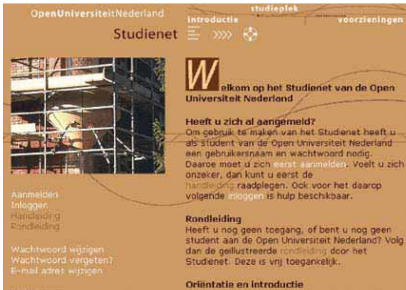
Schermafdruck van de aanmeldpagina in Studienet 1.1

Studienet is in de eerste jaren vooral qua uiterlijk tweemaal behoorlijk gewijzigd. In 1999 verschijnt de versie Studienet 1.1, die zich vooral onderscheidt door een aangepaste user interface met een herschikking van rubrieken en onderdelen. Een belangrijke technische wijziging is dat de sites door middel van database publishing worden gegenereerd, waardoor redacteurs handiger en flexibeler informatie kunnen publiceren. In versie 1.1 zijn daarnaast ook de mogelijkheden voor communicatie en interactie uitgebreid met realtime conferencing en groupwarefunctionaliteiten. Ook is de mogelijkheid voor het afspelen van streaming audio en video toegevoegd.