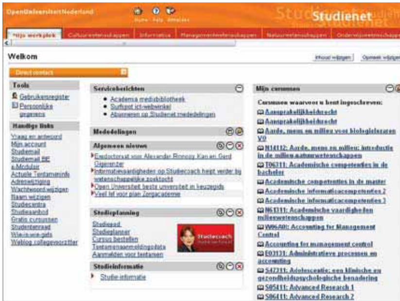
Schermafdruk van Studienet 2.0

(onderdeel van het Onderwijs service centrum) en de automatiseringsafdeling ICTS. In dit nieuwe Studienet, versie 2.0, vormt Blackboard het hart; het vervult zowel de rol van portaal als van cursusmanagementsysteem. Alle faculteiten beschikken over een zogenaamde faculteitstab, een onderdeel van de werkplek van de studenten waarop specifieke faculteitsinformatie gecommuniceerd kan worden. Alle studenten hebben een eigen 'virtuele' harde schijf in het 'content system' van Blackboard. Voor de verdere invulling en uitbouw van Studienet 2.0 stellen de faculteiten een eigen basismodel voor hun cursussen vast. Het oude Studienet is opgeruimd en met de serviceafdeling Elosa wordt voorzien in een stabiele functionele ondersteuning van de elektronische leeromgeving, die in technische zin door het ICT Servicecentrum 24 uur per dag in de lucht wordt gehouden. Het is inmiddels ook voldoende duidelijk dat Blackboard alleen de klus niet kan klaren en dat het aangevuld moet worden met specifieke applicaties voor onder meer toetsing (Question Mark Perception) en online begeleiding (Elluminate). Naast Blackboard wordt in 2009 ook het open source cursusmanagementsysteem Moodle geïntroduceerd als uitleverplatform voor cursussen.