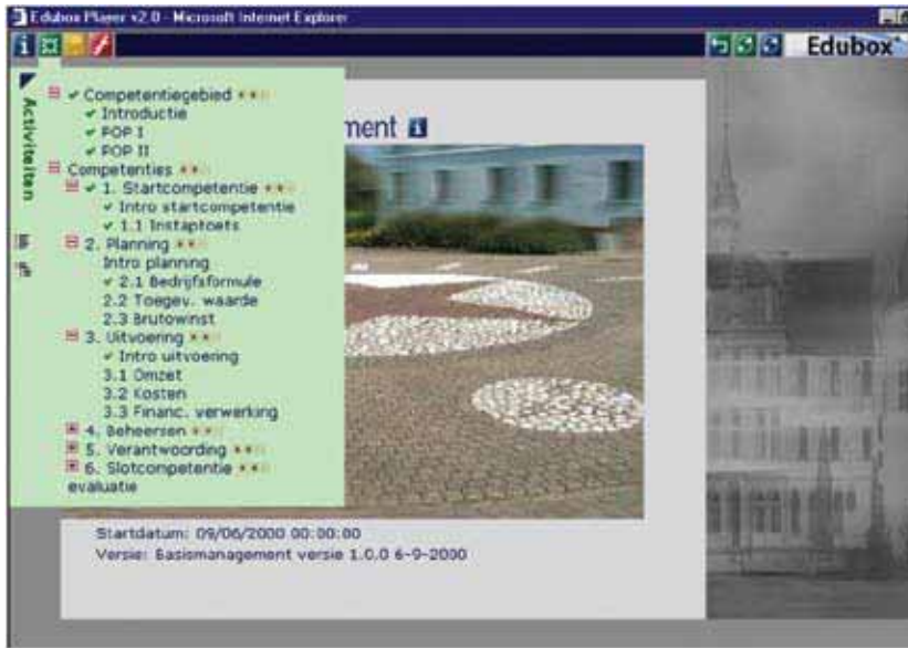
Schermafdruk van Edubox 2

In september 2002 lanceert de Open Universiteit Edubox (versie 3) als tweede kernapplicatie binnen (het oude) Studienet. Het betreft een commercieel ontwikkelde spin-off van een softwaresysteem dat is ontwikkeld binnen het elo-programma van OTEC, het huidige CELSTEC. Edubox wordt ontwikkeld om een belangrijke rol te spelen in de eigen innovatie én die van het hoger onderwijs in Nederland.