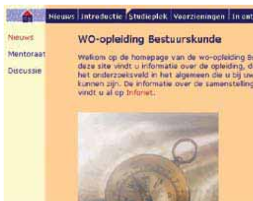
Schermafdruck van Studienet 1.0

In oktober 1997 ziet Studienet het licht. Deze online leeromgeving is te zien als een elektronische aanvulling op enerzijds de studeeromgeving van de studenten en anderzijds de mogelijkheden van docenten om studenten te begeleiden. Centraal staan de cursussen, die hoofdzakelijk bestaan uit schriftelijk materiaal met ingebouwde begeleidingscomponenten, zoals studeeraanwijzingen, kernwoorden en zelftoetsen, allemaal bedoeld om ervoor te zorgen dat het materiaal zelfstandig bestudeerbaar is. Waar nodig krijgen studenten ook geluidscassettes, videobanden en computerondersteund materiaal aangeboden. Deze componenten worden met de opkomst van internet, of beter gezegd het world wide web, vanaf 1997 eerst aangevuld met het medium Studienet en later steeds meer erdoor vervangen. Het is duidelijk dat de mogelijkheden van de informatie- en communicatietechnologie en de mogelijkheden van het web uitstekend passen bij het afstandsonderwijs van de Open Universiteit.