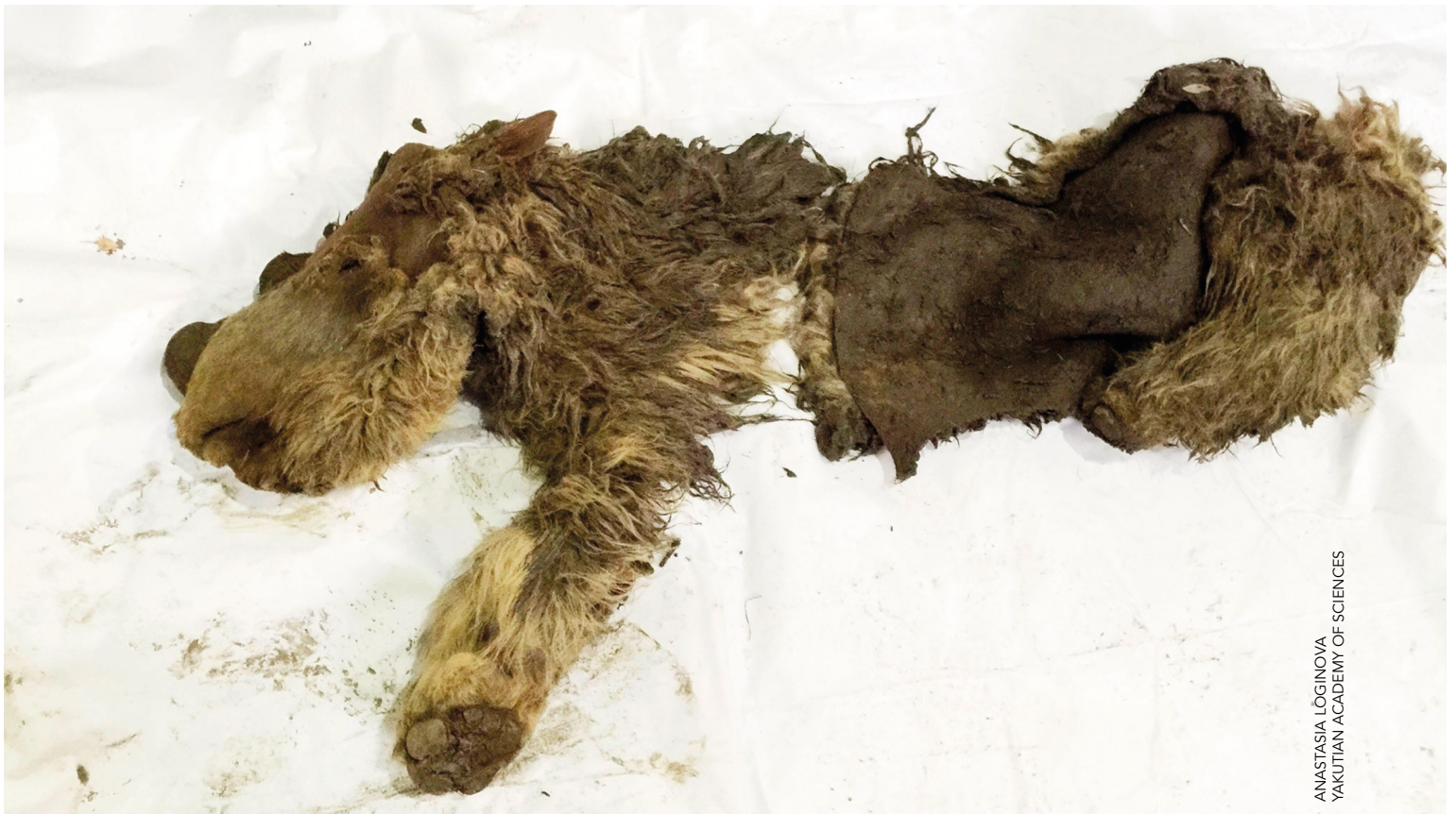
Figure 1. Sasha, the baby woolly rhinoceros, Coelodonta antiquitatis (Blumenbach, 1799), found in north-eastern Siberia in 2015. This was the first find of a whole body of woolly rhino in permafrost.

We hebben eerder gepubliceerd over coprofagie bij mammoeten (Van Geel et al., 2008, 2011a,b). Coprofagie is belangrijk omdat daarmee bepaalde nutriënten en vitaminen die in de darmen door de microflora worden gevormd (en daar niet meer voldoende worden geabsorbeerd) beschikbaar komen voor een dier dat mest eet. Met andere woorden: het eten van mest is nuttig. Coprofagie is waargenomen bij