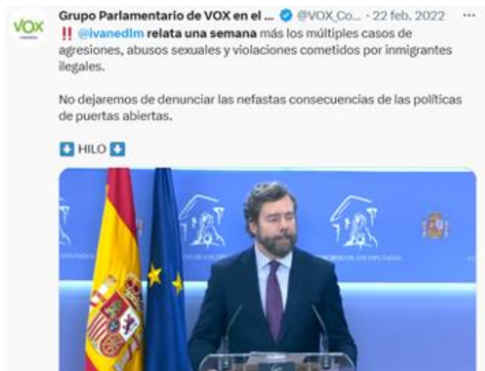
Figura 2. Ejemplo de uno de los mensajes del partido político VOX en la red social Twitter.

donde victimario y víctima se conocen e, incluso son o han sido pareja, están infrarrepresentadas en las estadísticas).