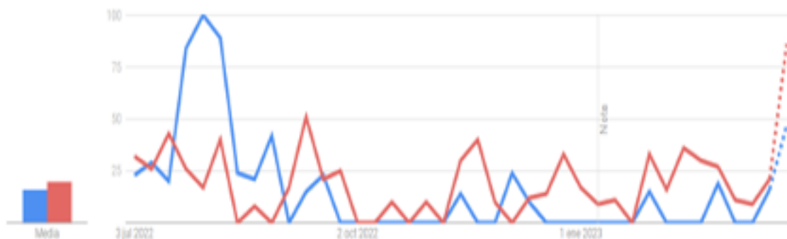
Figura 6. Evolución y relación del número de búsquedas en Google. Nota: en azul, “viruela del mono”; en rojo, “homosexualidad”.

correlación entre “viruela del mono” y “homosexualidad”, aunque de forma más irregular y menos acentuada que en la correlación establecida para el problema de las agresiones sexuales en relación con la inmigración, muestra una subida considerable en el uso de “homosexualidad” cuando más crecen y preocupan los casos de viruela del mono, sobre todo a comienzos del verano de 2022. De hecho, en algunos intervalos temporales el uso del término “homosexualidad” asociado a “viruela del mono” es superior (Figura 6).