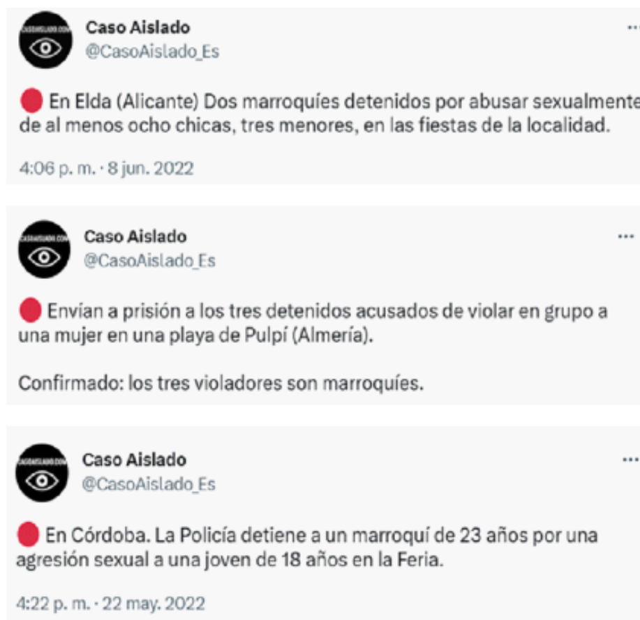
Figura 4. Mensajes n.º 1, 2 y 3 de Caso Aislado.