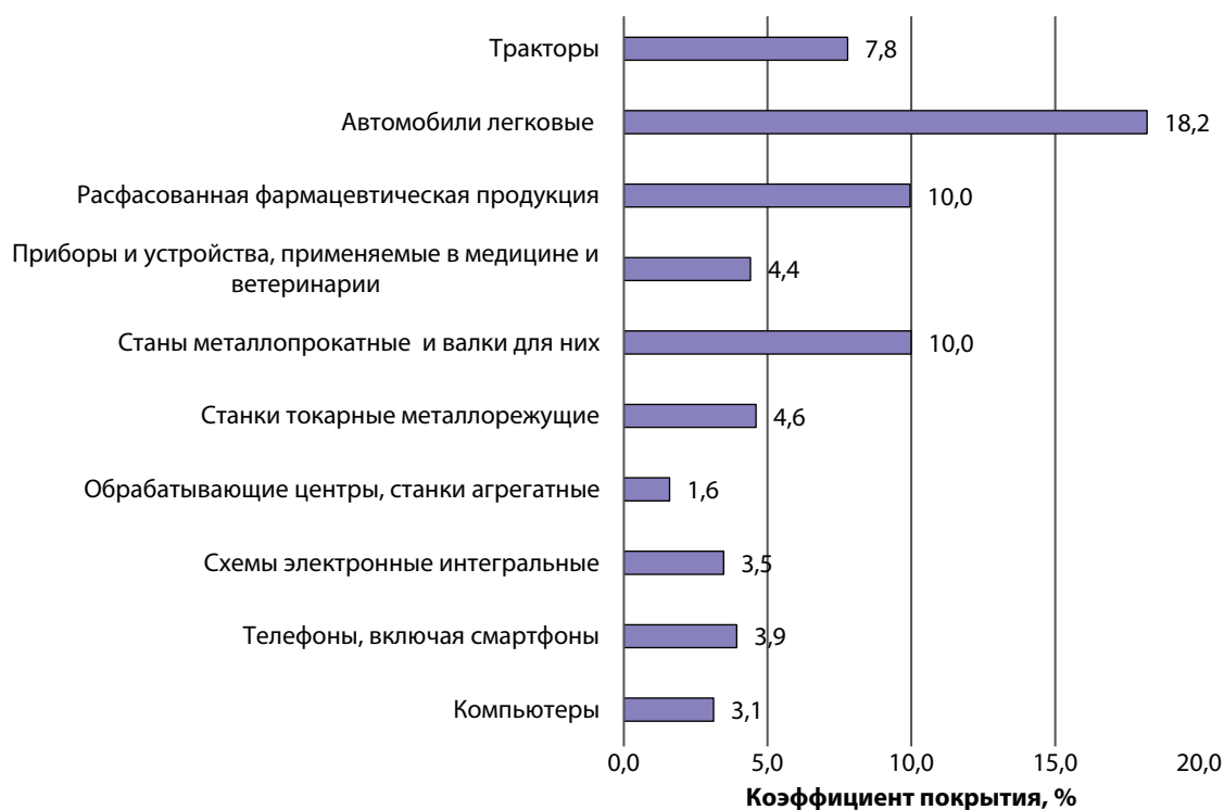
Рис. 1. Коэффициент покрытия импорта экспортом в целом по РФ по ряду высокотехнологичных товаров в 2021 г. (источник: рассчитано по данным Таможенной службы РФ. URL: http://stat.customs.gov.ru/ (дата обращения: 27.01.2022))