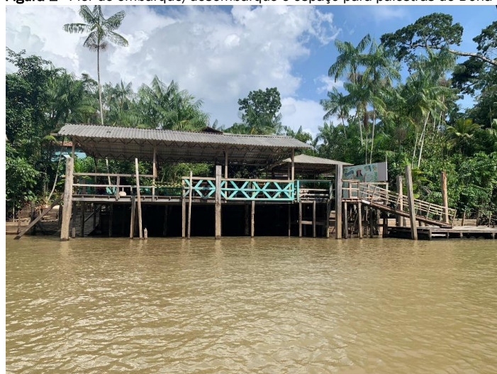
Figura 1 - Píer de embarque/desembarque e espaço para palestras de Dona Nena