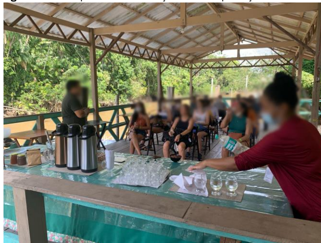
Figura 3 - Guia repassando informações sobre a produção do chocolate