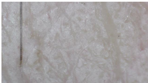
Figura 6. Exemple d'imatge de la pell d'una persona vista a través de la lupa digital.

Estem d'acord amb Couso i Sanmartí que "allò que veritablement motiva a aprendre és creure que tu, siguis qui siguis, pots tenir èxit aprenent. La identitat i el seu paper en interessos, percepció