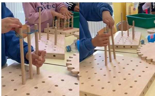
Figura 4. Catapulta construïda pel Rafael en l'espai Tinkering

El grup de quart visita l'aula STEM i se li proposa el següent repte amb el panell: "Heu de fer un circuit per on passi una bala". Com que aquest alumnat ja ha visitat abans l'aula STEM se'ls demana primer que facin un prototip dibuixat de com serà aquest circuit, quins materials inclourà... Un cop dissenyat el circuit el construeixen i proven. Funciona?, compleix els requisits del repte? (Figura 5).