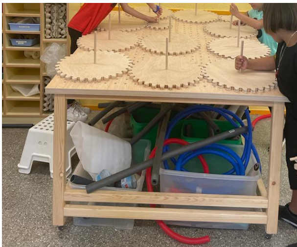
Figura 3. Espai Tinkering: Panell inclinat i material que es posa a disposició de l'alumnat.