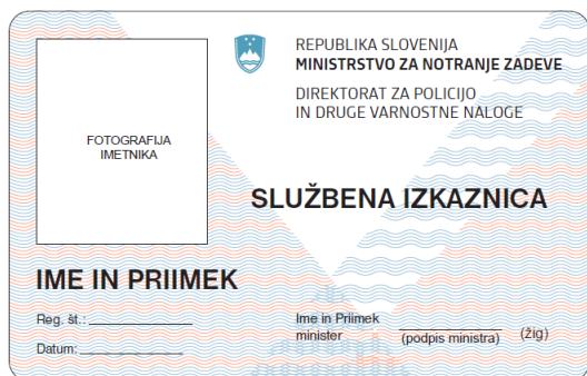
Sprednja stran identifikacijske izkaznice

Na sprednji strani so podatki natisnjeni v črni barvi. Grb Republike Slovenije je moder, v barvnem sistemu Pantone 549. Linije v podlagi so modre in rdeče barve.