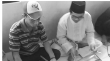
Gambar 2. Kegiatan mendata peserta PKM

pelatihan di Dusun Lengese. Tim pengabdian bertemu pada hari minggu tanggal 20 Juli 2022, dikarenakan selain hari tersebut baik tim pengabdian dan kepala desa memiliki kesibukan dan kewajiban pada tugasnya masing-masing. Pada tanggal 20 Juli tim pengabdian bertemu dengan Kepala dusun beserta beberapa orang perwakilan dari warga bertemu. Pada kegiatan ini tim pengabdian memberikan penjelasan kepada mitra terkait kegiatan IbM yang akan dilaksanakan, tempat dan waktu pelaksanaan penyuluhan dan pelatihan. Pada pertemuan ini ada beberapa hal yang disepakati, yaitu kegiatan sosialisasi kegiatan IbM, waktu dan tempat pelaksanaan penyuluhan, serta waktu dan tempat pelaksanaan pelatihan pembuatan produk bernilai ekonomis dari limbah plastik. Waktu Pelaksanaan kegiatan pengabdian ini berlangsung selama 2 hari yaitu pada tanggal 10 dan 11 Agustus 2022 dengan jumlah 50 orang peserta, di mana puncak kegiatan dilakukan pada tanggal 11 Agustus 2022.