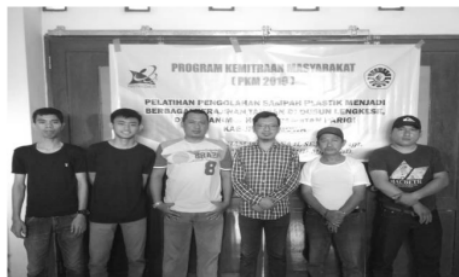
Gambar 1. Foto bersama Ketua Kelompok UKM Dusun Lengkese dan beberapa peserta PKM

Kegiatan pengabdian ini dilakukan di Dusun Lengkese, Desa Manimbahoi, Kecamatan Parigi, Kabupaten Gowa, dengan sasaran warga Dusun Lengkese Desa Manimbahoi, Kecamatan Parigi, di Kabupaten Gowa. Kegiatan pokok dalam program pengabdian ini adalah pelatihan serta pendampingan pembuatan bernilai ekonomis yang berasal dari limbah plastik yang tidak terpakai serta ketrampilan memasarkan produk tersebut dengan prinsip learning by doing (Mappiare, 1983; Anwar & Heryadi, 2004; Rochman, 2005).