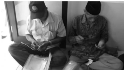
Gambar 7. Kegiatan membuat pot bunga

Pelatihan diberikan dalam bentuk ceramah yang dilanjutkan dengan proses praktek langsung dan tanya jawab. Praktek cara pembuatan pembuatan ornamen berbentuk bunga, keranjang plastik, dan pot bunga dari botol plastik. Warga dibagi ke dalam beberapa kelompok, kemudian dengan dibimbing tim pengabdian mempraktekkan sendiri pembuatan produk tersebut. Pelatihan dilaksanakan sampai semua peserta mahir mempraktekkan sendiri (Nurazizah dkk., 2021).