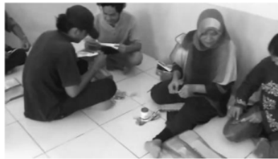
Gambar 6. Kegiatan membuat ornamen bunga

Penyuluhan diadakan di rumah salah satu warga Dusun Lengkese, dengan dihadiri oleh warga Dusun Lengkese yang dilaksanakan hari Sabtu tanggal 10 Agustus 2022, dan dilanjutkan pada hari Minggu 11 Agustus 2022. Materi yang disampaikan adalah pengolahan limbah plastik serta peluang usaha rumahan, materi pembuatan produk, pengemasan dan pemasaran produk, khususnya produk hasil kerajinan tangan yang bernilai ekonomis (Sirait, 2009).