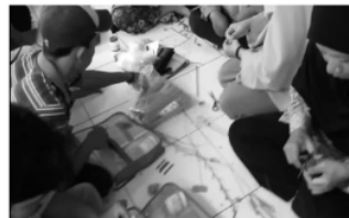
Gambar 4. Kegiatan memilah limbah plastik yang layak dipakai

Alat dan bahan yang dibutuhkan pada pelatihan pembuatan ornamen berbentuk bunga, keranjang plastik, dan pot bunga dari botol plastik, antara lain botol plastik bekas dan gelas air mineral bekas, cutter, lem, pewarna, label kertas, pisau, gunting dan wadah plastik besar.