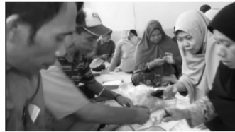
Gambar 3. Kegiatan memisahkan limbah plastik

Persiapan kegiatan ini berupa penyediaan limbah plastik (botol air mineral, gelas air mineral, dll), pembuatan modul penyuluhan dan pelatihan. Modul penyuluhan berisi materi dasar tentang manfaat lain limbah plastik, teknik pengolahan limbah plastik, dan pemasaran produk. Produk ornamen berbentuk bunga, keranjang plastik, pot bunga dari botol plastik (Aminuddin & Nurwati, 2019). Modul pelatihan berisi tentang bahan-bahan, alat-alat dan cara pembuatan produk tersebut.