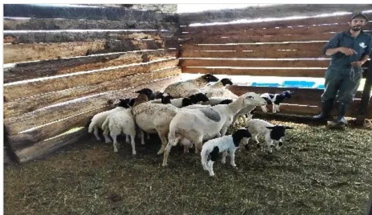
Figura 2. Tenjo - Cundinamarca Criadero Ovino J.C.