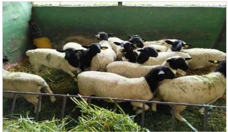
Figura 4. Tenjo - Cundinamarca, Criadero Ovino J.C.