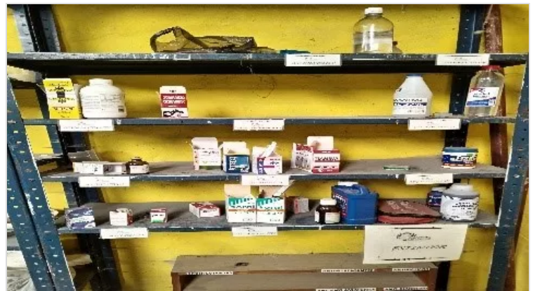
Figura 11. medicamentos e insumos empleados en el Criadero Ovino J.C.