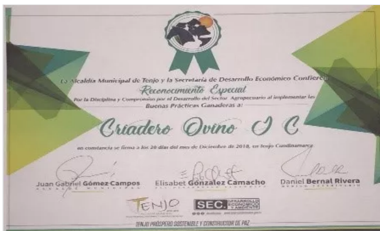
Figura 8. Certificación 2