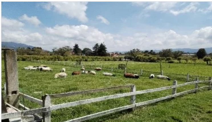
Figura 3. Tenjo - Cundinamarca, Criadero Ovino J.C.