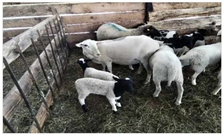
Figura 10. Tenjo - Cundinamarca, Criadero Ovino J.C.