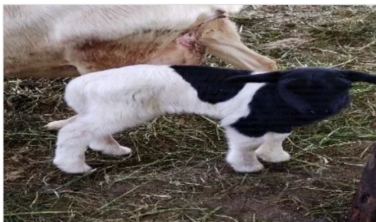
Figura 1. Tenjo - Cundinamarca, Criadero Ovino J.C.