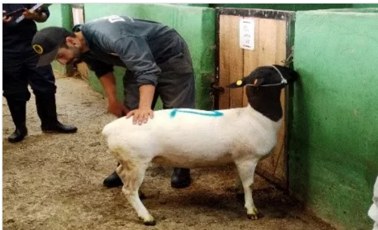
Figura 5. Tenjo - Cundinamarca, Criadero Ovino J.C.