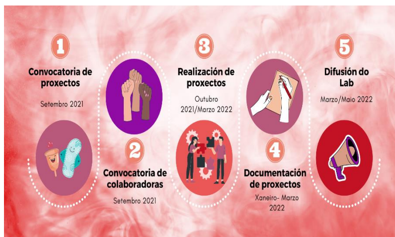
Figura 3. Cronoloxía do proxecto